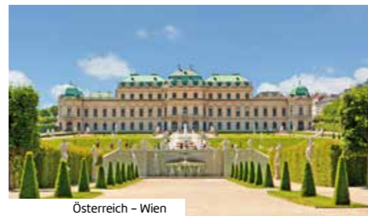
Österreich – Wien

REISEZEITRAUM: Sep 24 – Mrz 25 REISEDAUER: 16 ODER 17 Nächte REISE-CODE: K89131