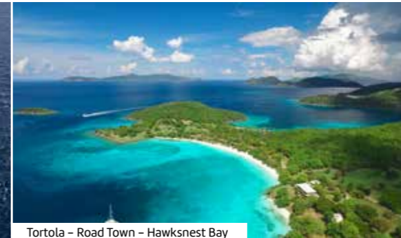
Tortola – Road Town – Hawksnest Bay