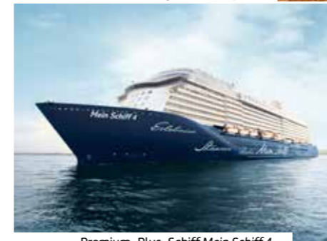
Premium-Plus-Schiff Mein Schiff 4

Aktuelle Preise, Reiseternine, Abflughäfen, Einreisebestimmungen, weitere Informationen und Buchung unter: www.berge-meer.de/K8F117