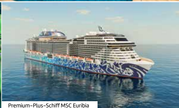
Premium-Plus-Schiff MSC Euribia