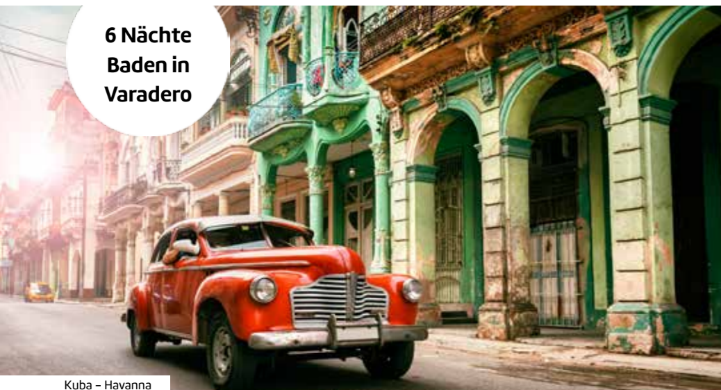
Kuba - Havanna