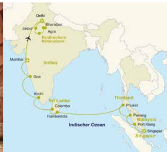
Thailand – Phuket

Kultur-Entdecker All-Inclusive Neu und anders