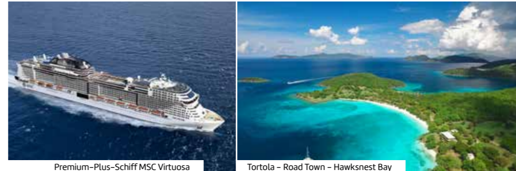
Premium-Plus-Schiff MSC Virtuosa