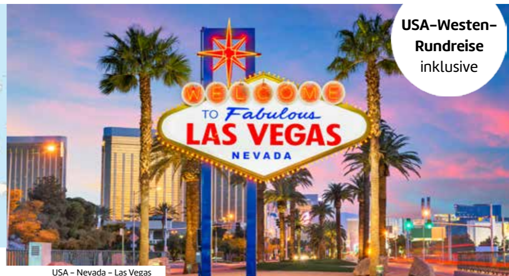
USA - Nevada - Las Vegas