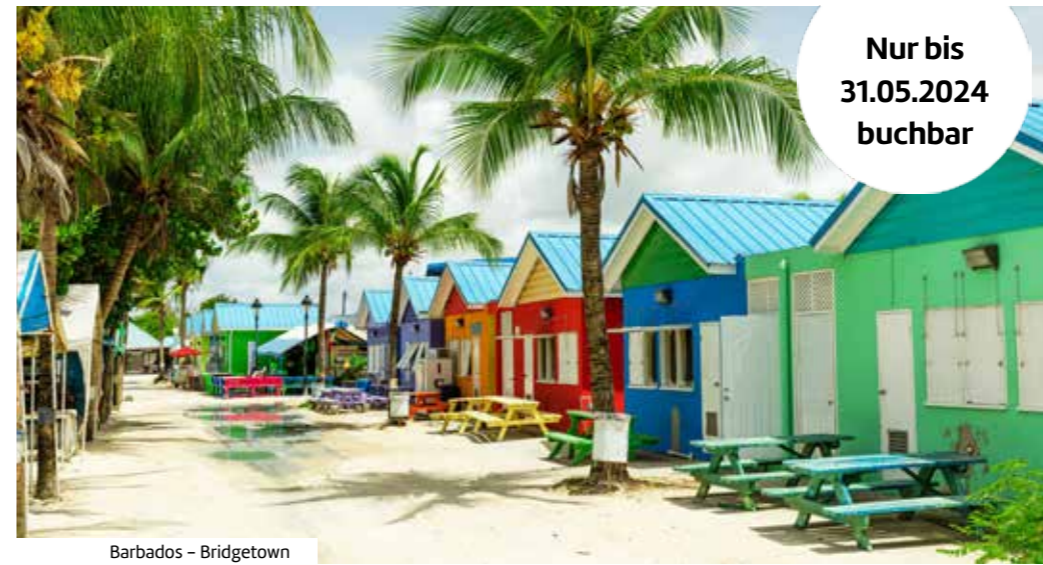
Barbados – Bridgetown