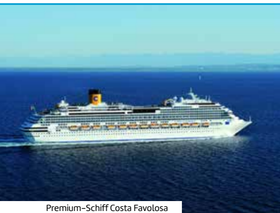
Premium-Schiff Costa Favolosa

REISEZEITRAUM: Jul – Aug 24 REISEDAUER: 12 Nächte REISE-CODE: K8W139 Aktuelle Preise, Reiseternine, Abflughäfen, Einreisebestimmungen, weitere Informationen und Buchung unter: www.berge-meer.de/K8W139