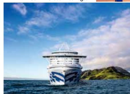
Premium-Plus-Schiff Grand Princess