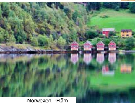
Norwegen - Flåm