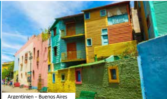
Argentinien – Buenos Aires