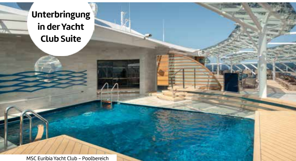
MSC Euribia Yacht Club - Poolbereich