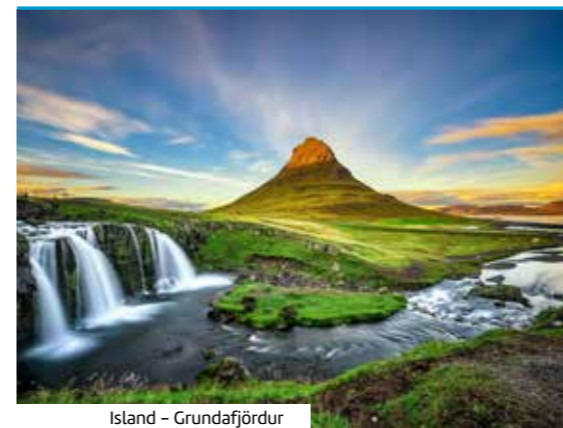
Island – Grundarfjörður

REISEZEITRAUM: Jun – Jul 25 REISEDAUER: 22 Nächte REISE-CODE: K8W436 Aktuelle Preise, Reiseternine, Einreisebestimmungen, weitere Informationen und Buchung unter: www.berge-meer.de/K8W436