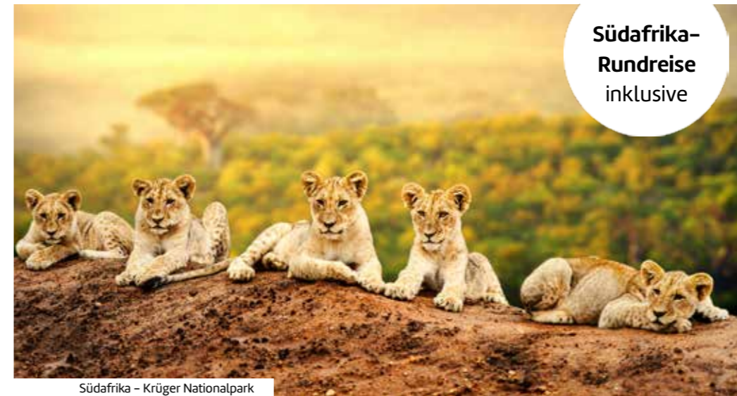
Südafrika - Krüger Nationalpark

Unser Partner Royal Caribbean INTERNATIONAL