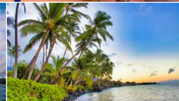
Hawaii - Lahaina