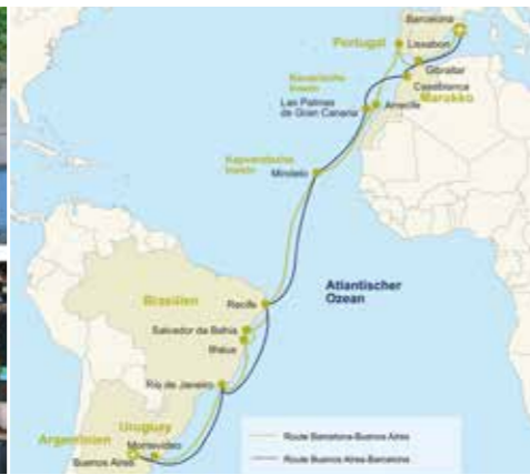
Argentinien – Buenos Aires