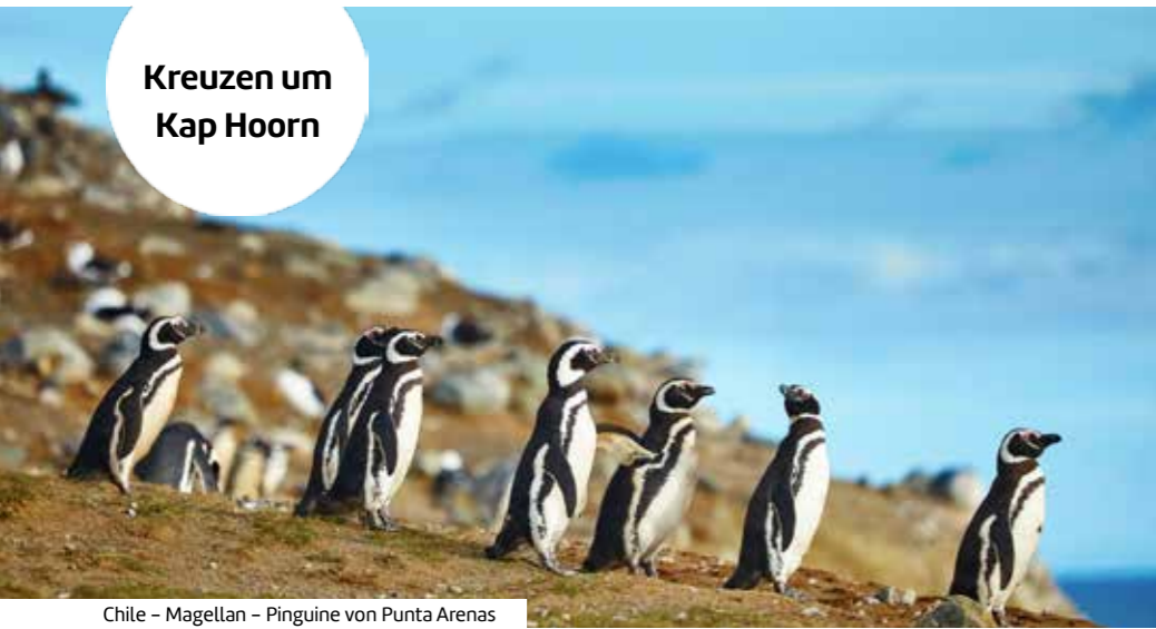
Chile – Magellan – Pinguine von Punta Arenas