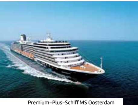
Premium-Plus-Schiff MS Oosterdam