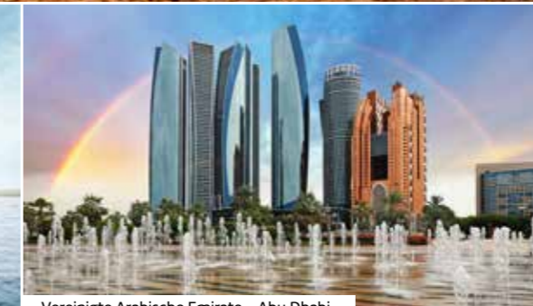
Vereinigte Arabische Emirate - Abu Dhabi