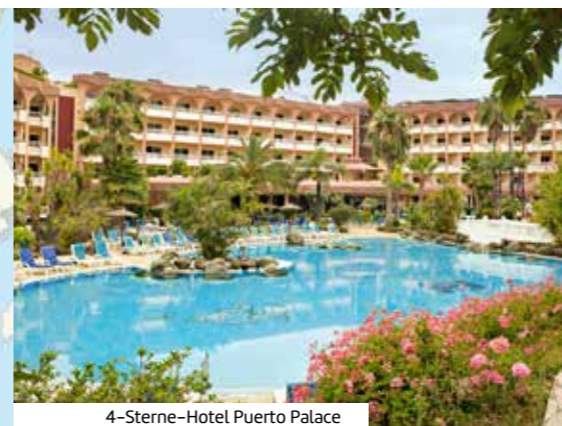
4-Sterne-Hotel Puerto Palace