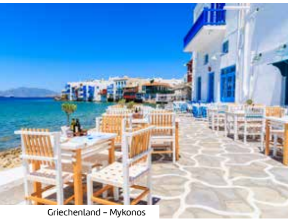
Griechenland - Mykonos