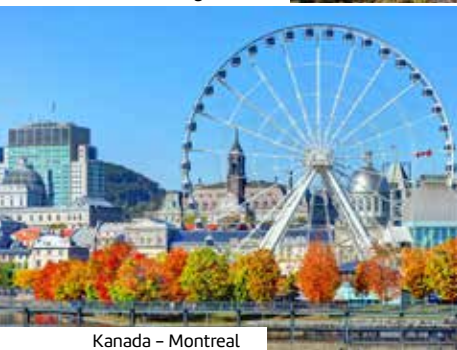
Kanada – Montreal