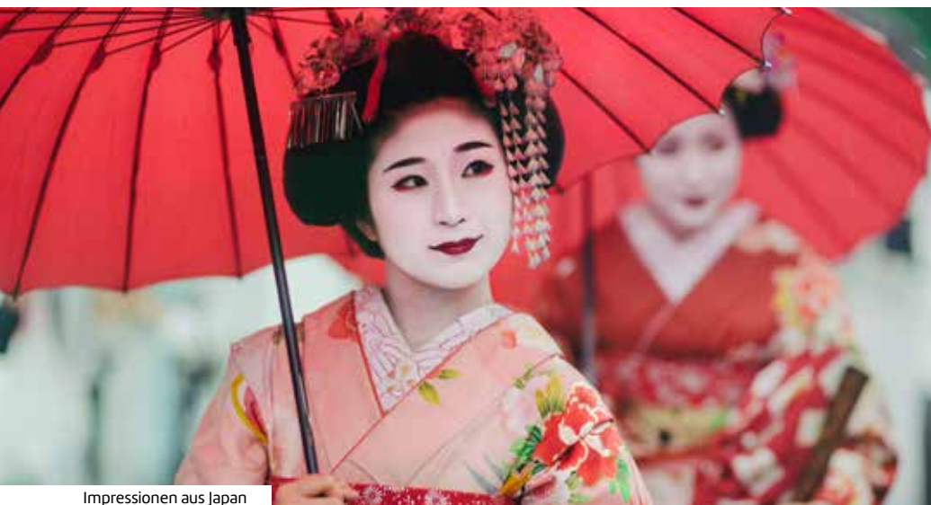
Impressionen aus Japan