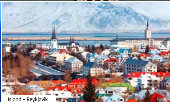
Island - Reykjavik