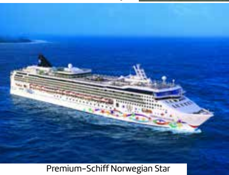
Premium-Schiff Norwegian Star