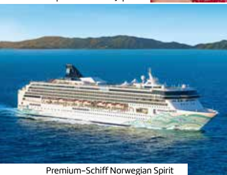
Premium-Schiff Norwegian Spirit