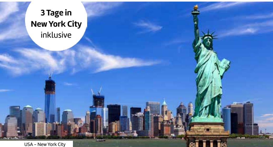
USA - New York City