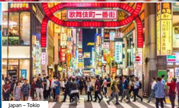
Japan - Tokio