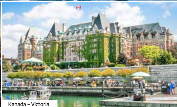
Kanada – Victoria