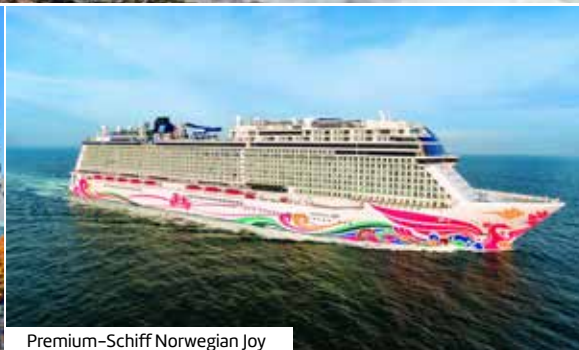
Premium-Schiff Norwegian Joy