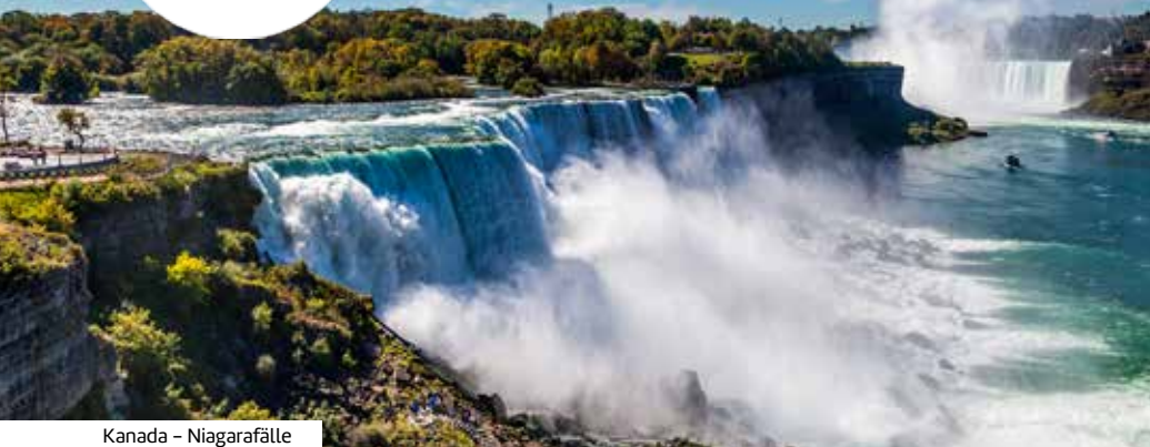
Kanada – Niagarafälle