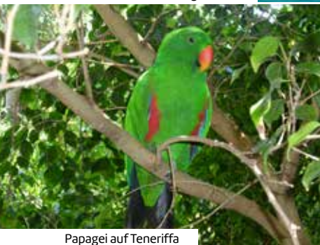
Papagei auf Teneriffa