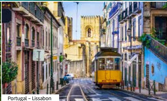
Portugal – Lissabon