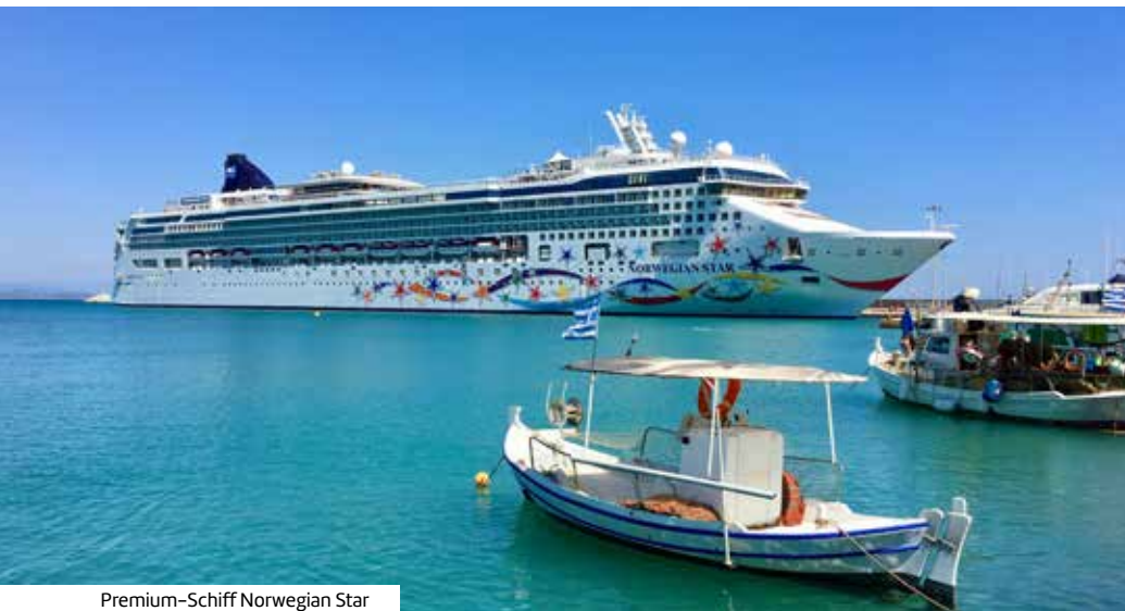
Premium-Schiff Norwegian Star