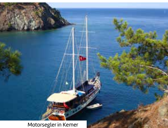
Motorsegler in Kemer