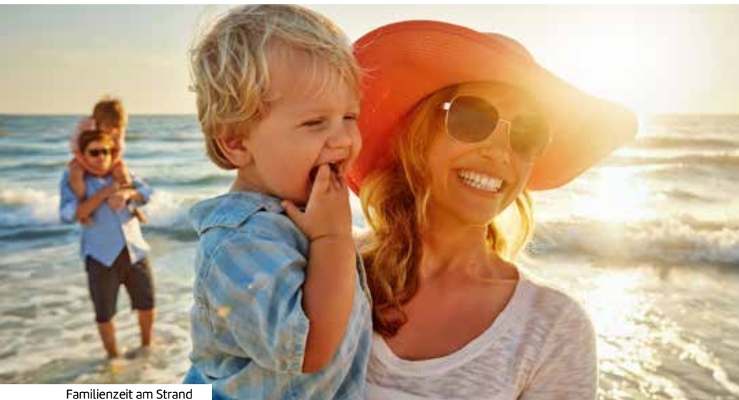
Familienzeit am Strand