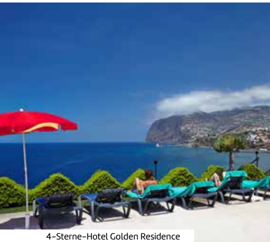
4-Sterne-Hotel Golden Residence