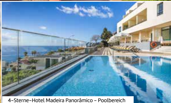
4-Sterne-Hotel Madeira Panorâmico – Poolbereich