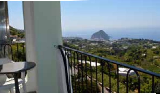
3-Sterne-Hotel La Ginestra – Doppelzimmer Meerblick