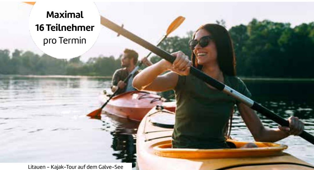
Litauen – Kajak-Tour auf dem Galve-See