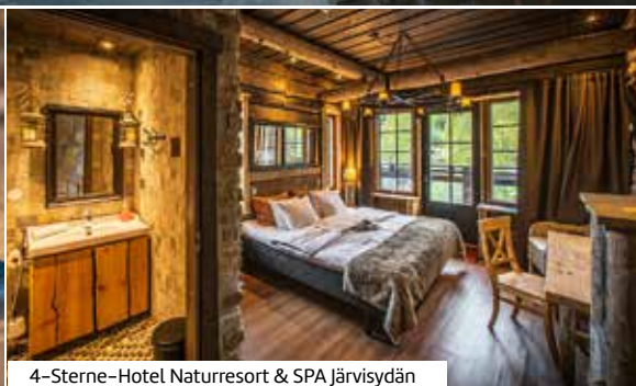
4-Sterne-Hotel Naturresort &amp; SPA Järvisydän