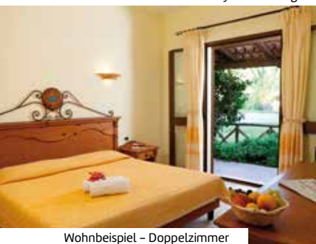
Wohnbeispiel – Doppelzimmer