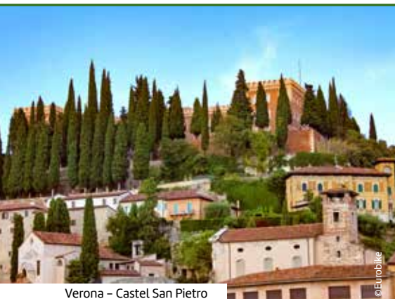
Verona – Castel San Pietro