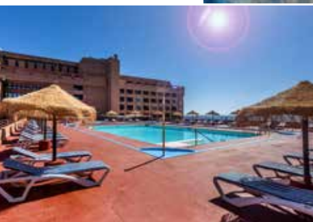
4*-Hotel Las Palmeras Affiliated by Fergus