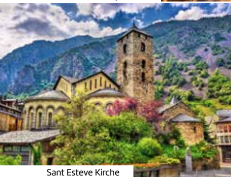
Sant Esteve Kirche