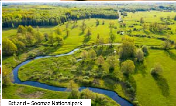
Estland – Soomaa Nationalpark