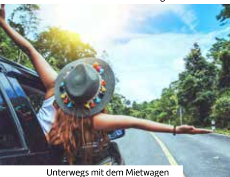
Unterwegs mit dem Mietwagen