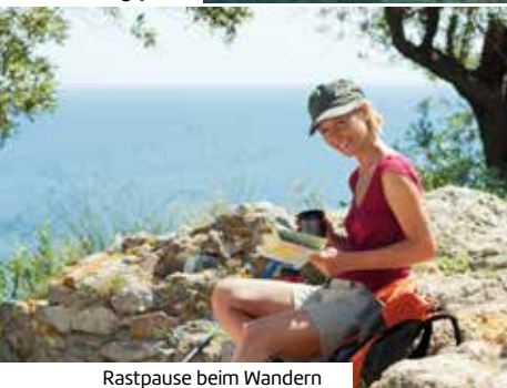
Rastpause beim Wandern