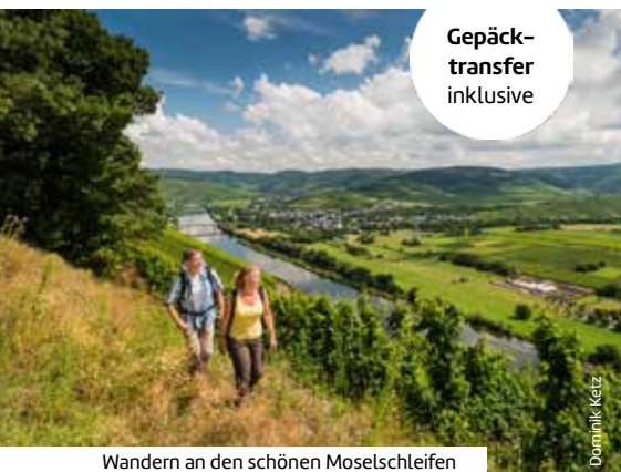
Wandern an den schönen Moselschleifen