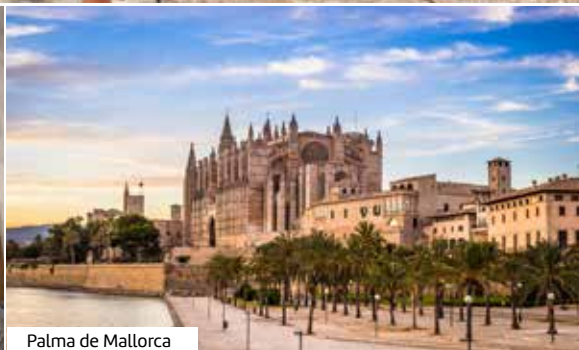
Palma de Mallorca