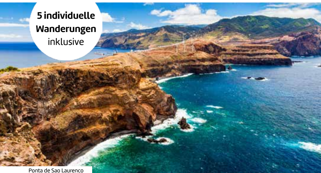
Ponta de Sao Laurencio