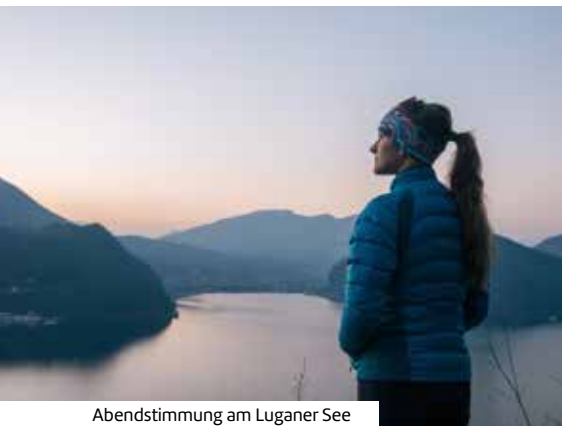
Abendstimmung am Luganer See