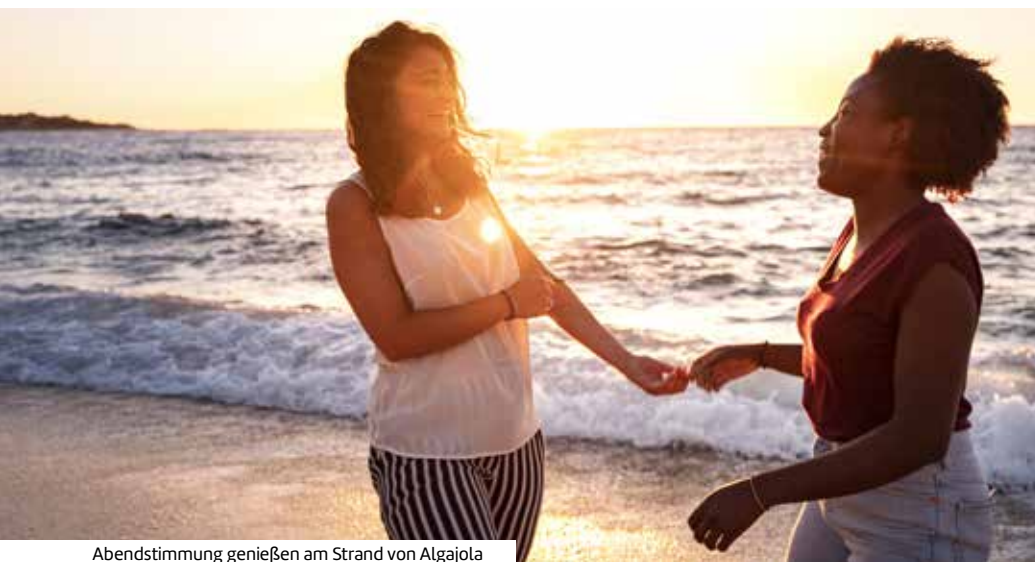
Abendstimmung genießen am Strand von Algajola