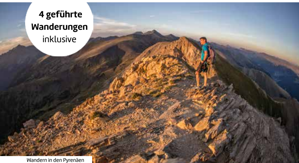
Wandern in den Pyrenäen