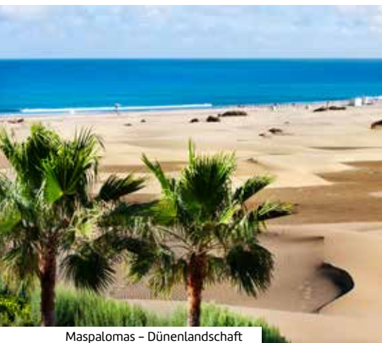
Maspalomas – Dünenlandschaft

REISEZEITRAUM: November 23 – April 24 REISEDAUER: 21, 28 bzw. 35 Nächte REISE-CODE: LEL012