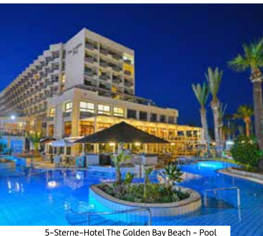
5-Sterne-Hotel The Golden Bay Beach – Pool