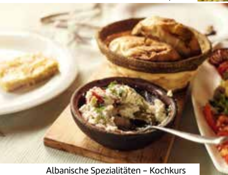
Albanische Spezialitäten – Kochkurs