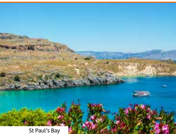
St Paul's Bay

Aktuelle Preise, Reisettermine, Abflughäfen, Einreisebestimmungen, weitere Informationen und Buchung unter: www.berge-meer.de/B7F010