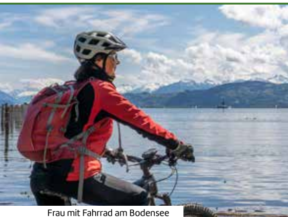
Frau mit Fahrrad am Bodensee

Hotel- und Freizeiteinrichtungen teils gegen Gebühr. Einzelzimmer (Zuschlag 120 € pro Person) buchbar.