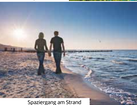
Spaziergang am Strand