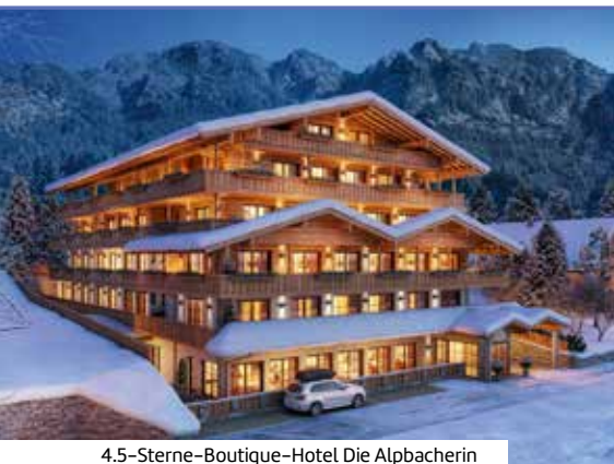
4.5-Sterne-Boutique-Hotel Die Alpbacherin