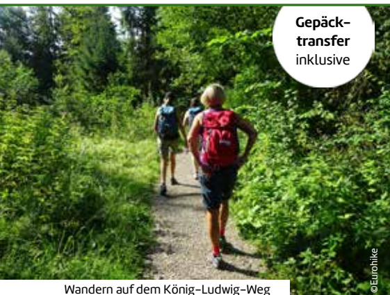
Wandern auf dem König-Ludwig-Weg

Verlängerungsnacht in Koblenz pro Person ab 85 €