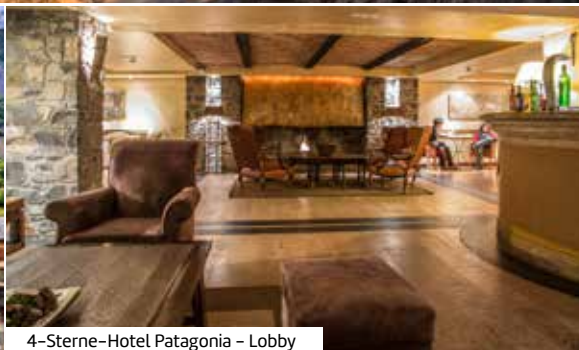
4-Sterne-Hotel Patagonia - Lobby