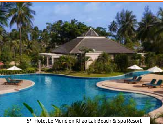
5*-Hotel Le Meridien Khao Lak Beach & Spa Resort