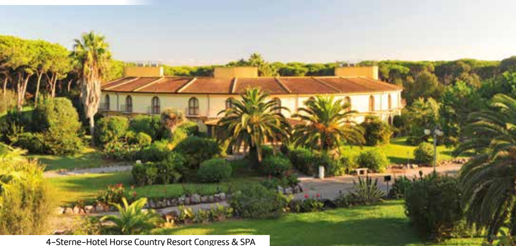
4-Sterne-Hotel Horse Country Resort Congress &amp; SPA