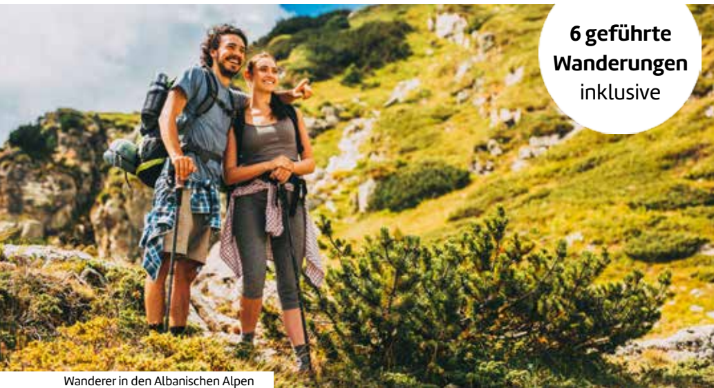
Wanderer in den Albanischen Alpen