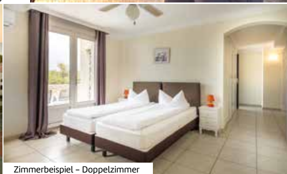
Zimmerbeispiel – Doppelzimmer