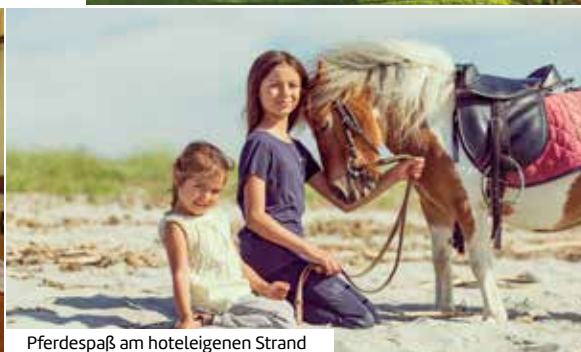
Pferdespaß am hoteleigenen Strand