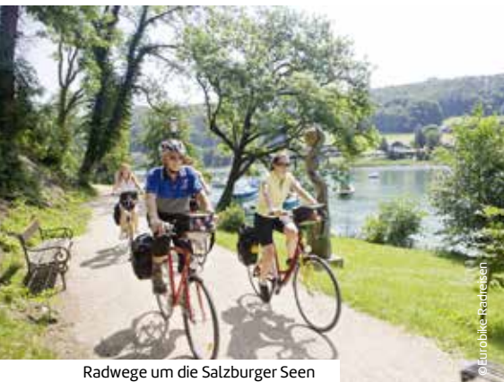
Radwege um die Salzburger Seen