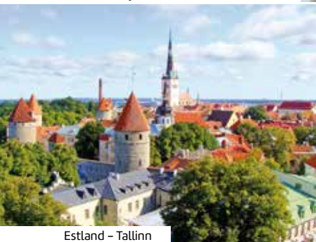
Estland – Tallinn