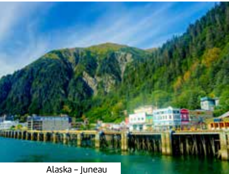
Alaska – Juneau