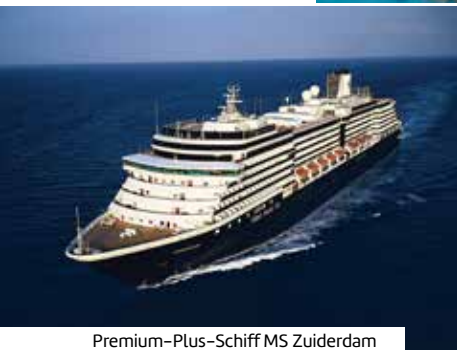
Premium-Plus-Schiff MS Zuiderdam