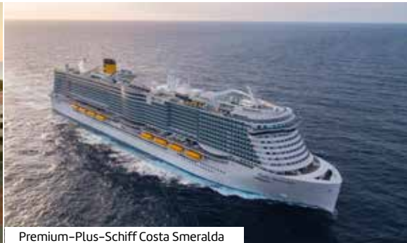
Premium-Plus-Schiff Costa Smeralda