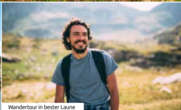
Wandertour in bester Laune