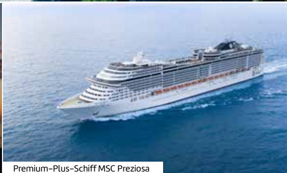
Premium-Plus-Schiff MSC Preziosa