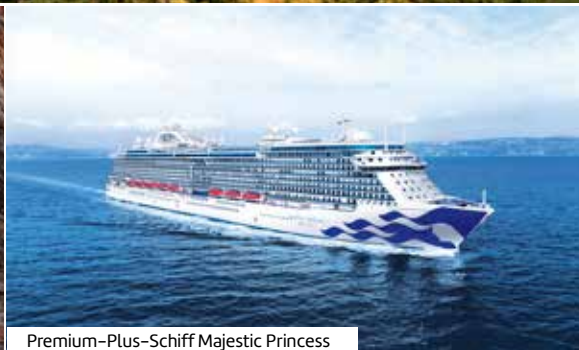
Premium-Plus-Schiff Majestic Princess