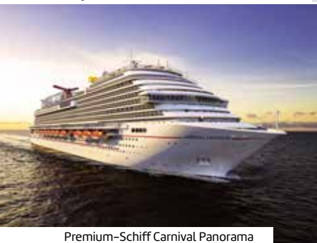
Premium-Schiff Carnival Panorama