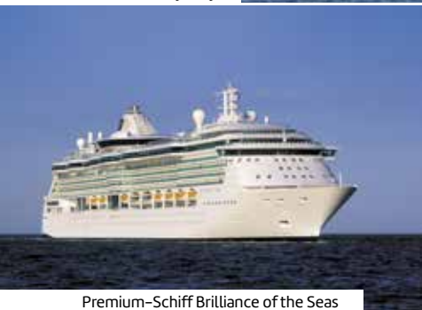
Premium-Schiff Brilliance of the Seas