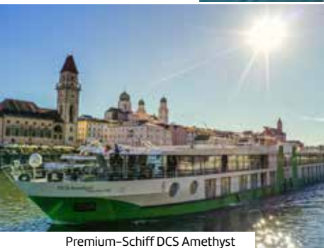
Premium-Schiff DCS Amethyst