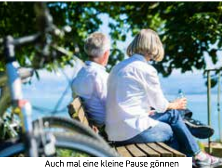
Auch mal eine kleine Pause gönnen

Mehr Informationen, Einreisebestimmungen und Buchung unter: www.berge-meer.de/K84146