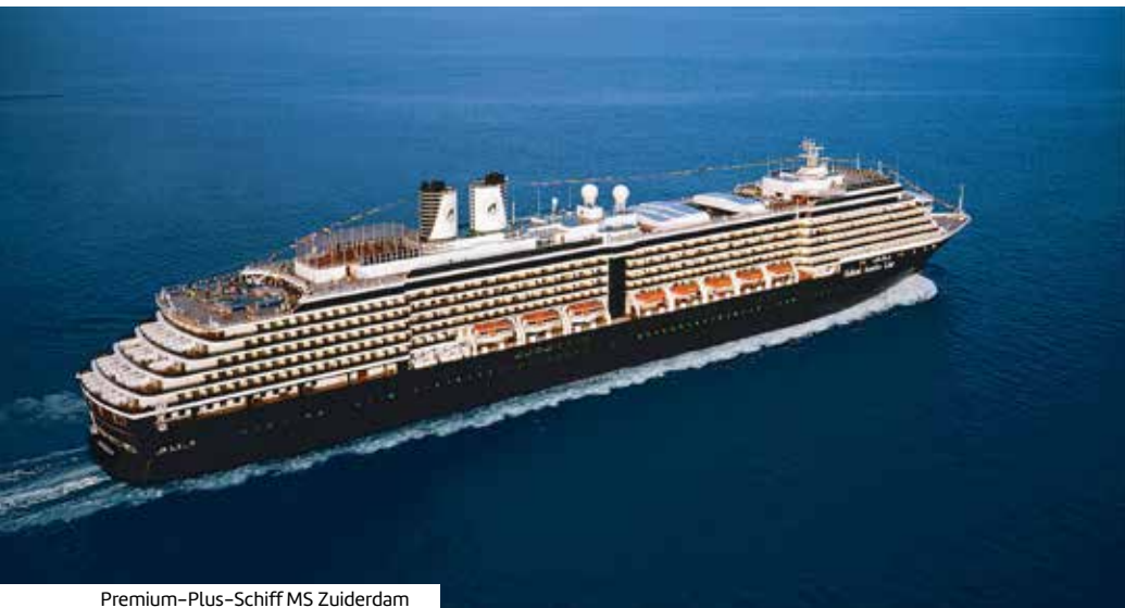
Premium-Plus-Schiff MS Zuiderdam