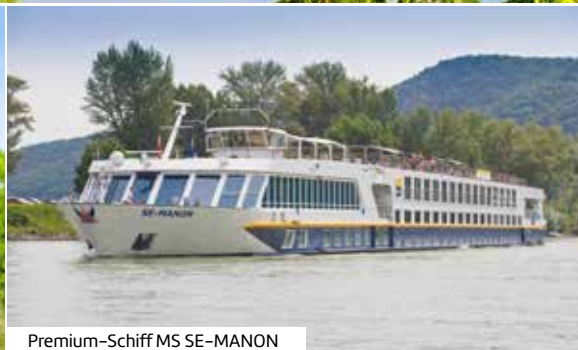
Premium-Schiff MS SE-MANON