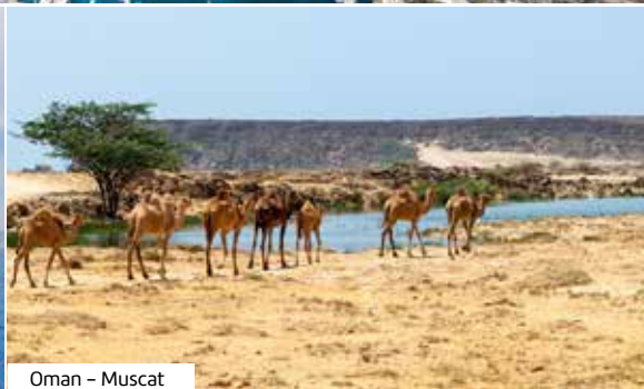
Oman – Muscat