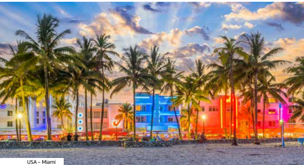
USA - Miami