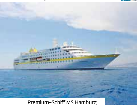
Premium-Schiff MS Hamburg