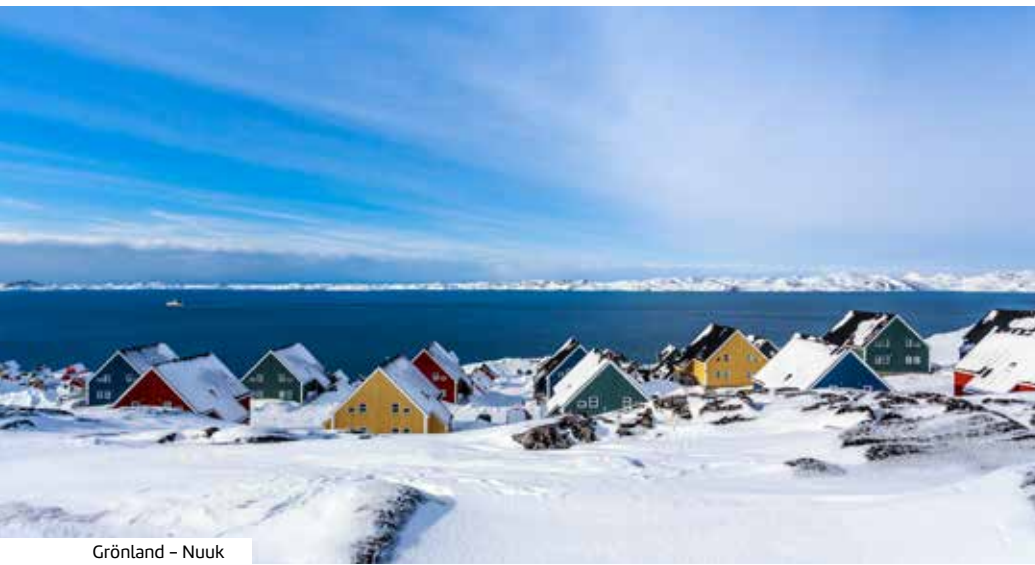
Grönland – Nuuk