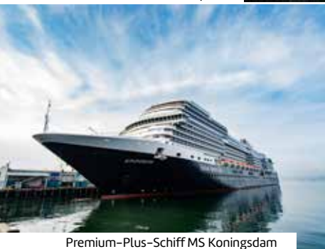
Premium-Plus-Schiff MS Koningsdam