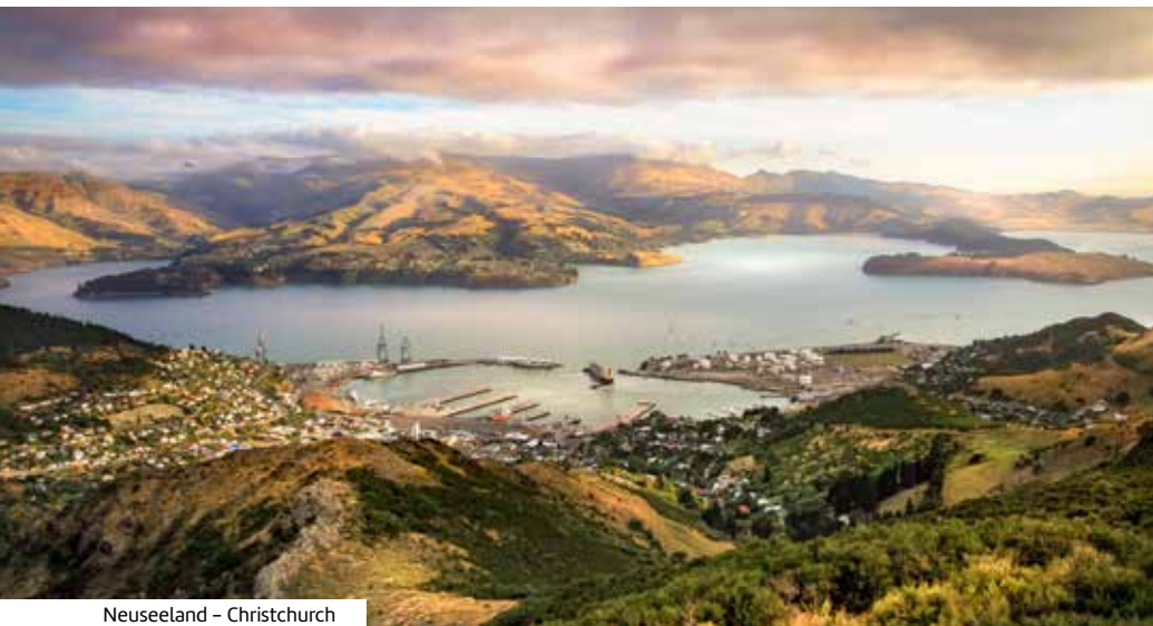
Neuseeland – Christchurch