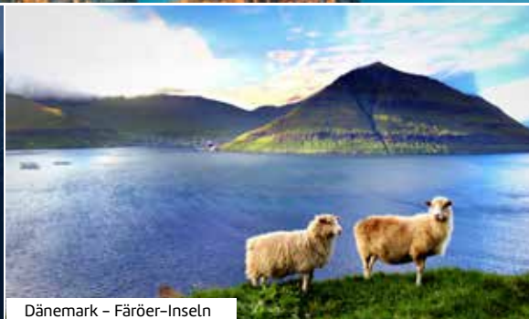
Dänemark – Färöer-Inseln