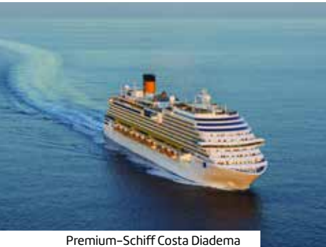
Premium-Schiff Costa Diadema