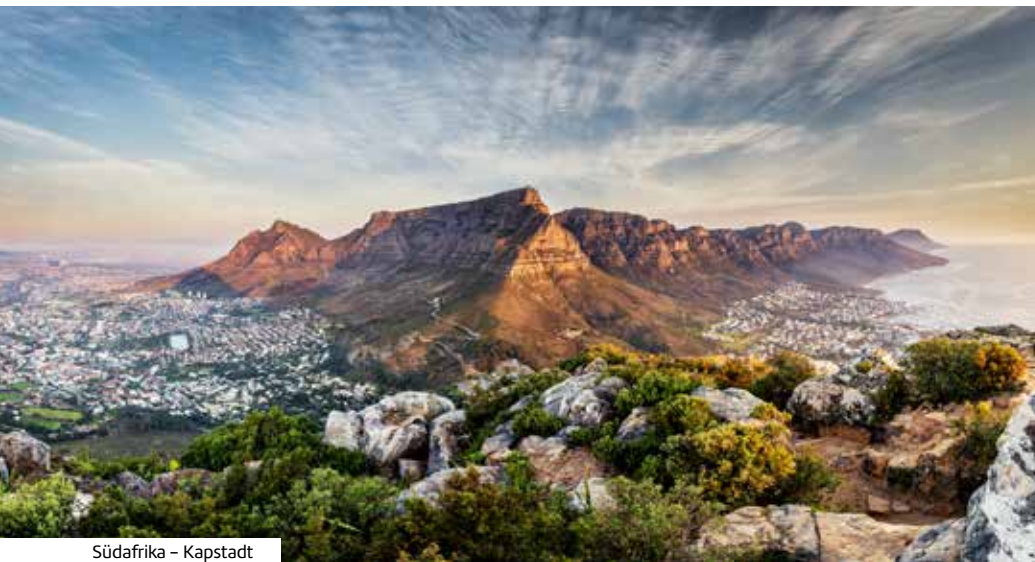
Südafrika – Kapstadt