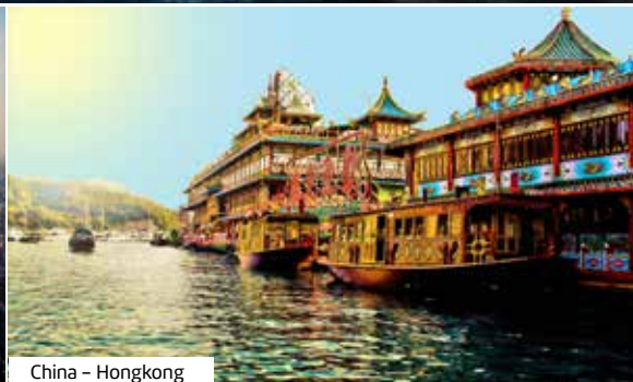
China - Hongkong