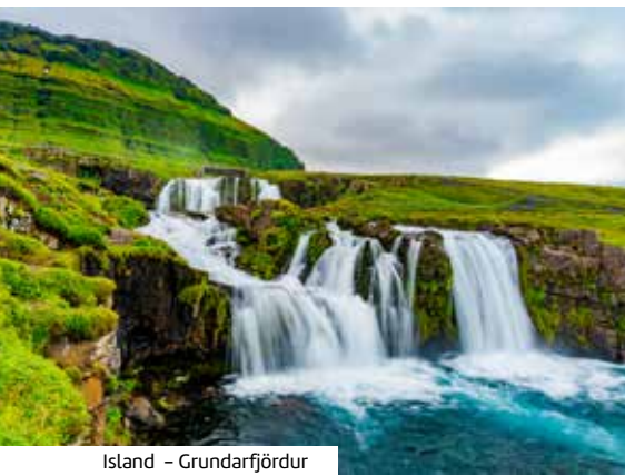
Island - Grundarfjörður