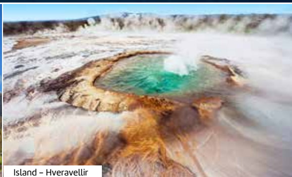
Island - Hveravellir