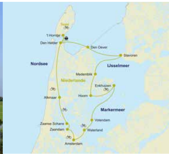
Radtour inmitten der ikonischen Windmühlen