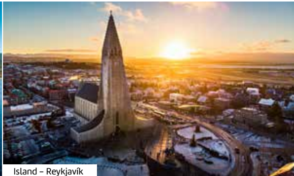
Island – Reykjavik