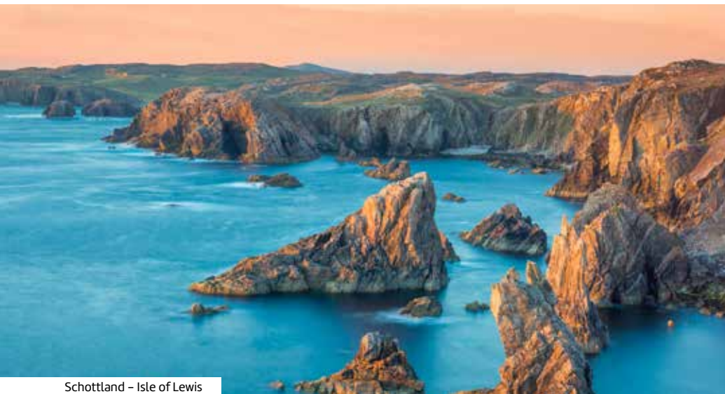
Schottland – Isle of Lewis