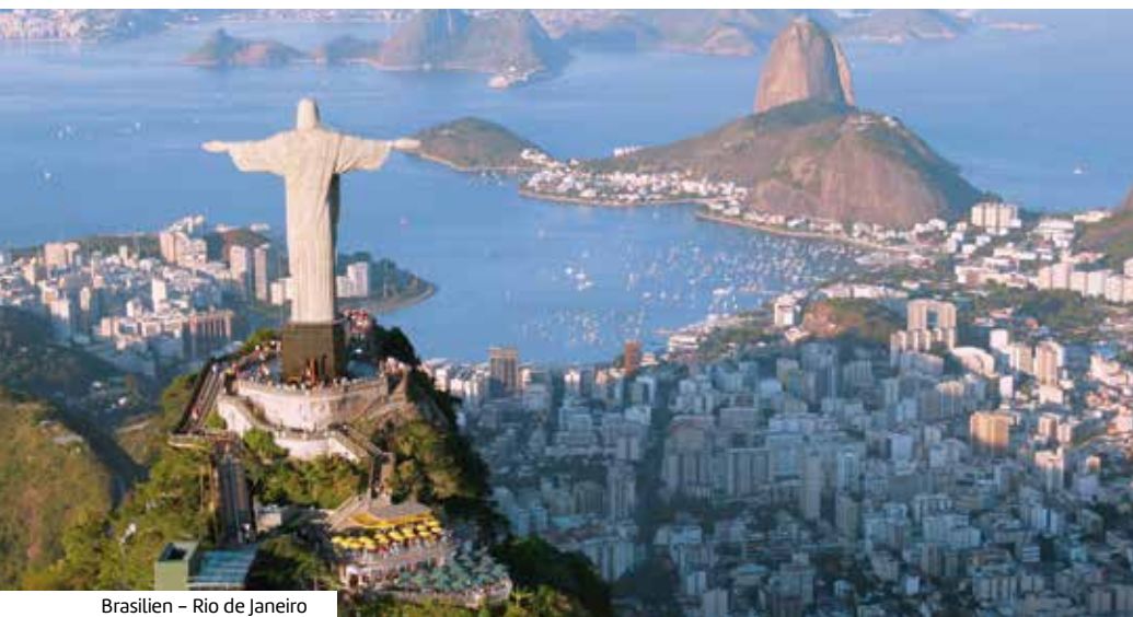
Brasilien – Rio de Janeiro