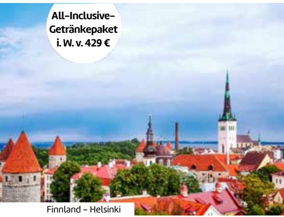
Finnland - Helsinki

All-Inclusive-Getränkepaket i. W. v. 429 €