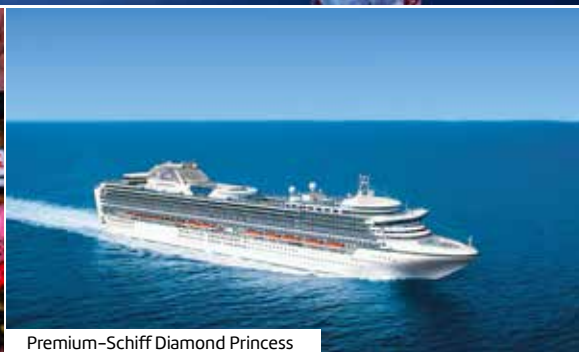
Premium-Schiff Diamond Princess