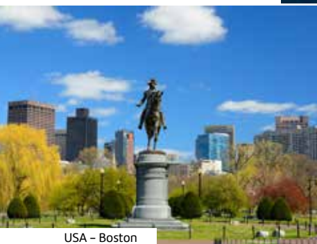
USA - Boston