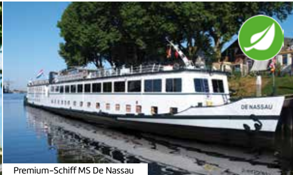
Premium-Schiff MS De Nassau