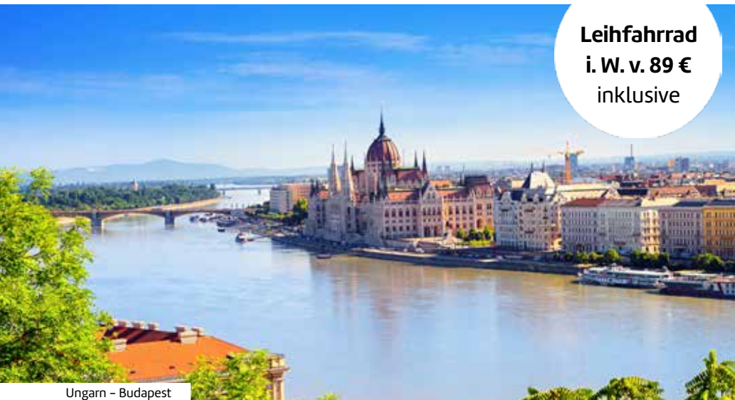
Ungarn – Budapest