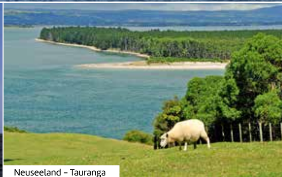
Neuseeland – Tauranga