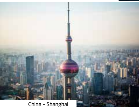
China - Shanghai