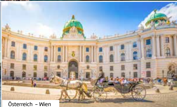
Österreich – Wien