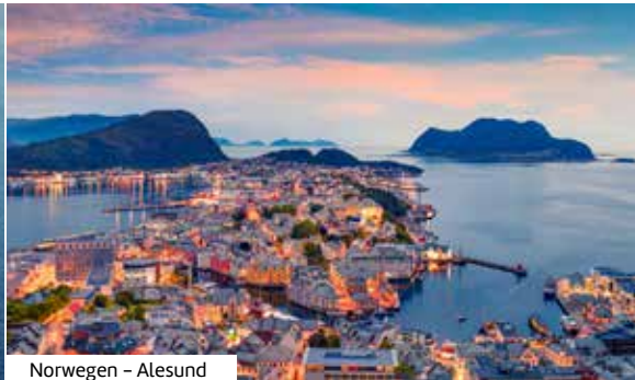
Norwegen – Alesund