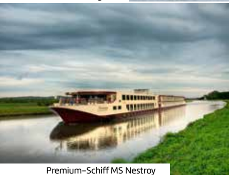
Premium-Schiff MS Nestroy