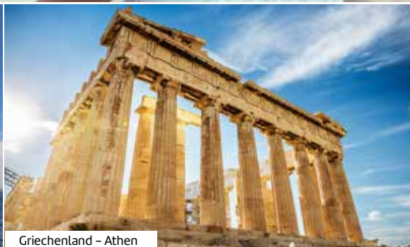
Griechenland – Athen