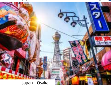
Japan – Osaka