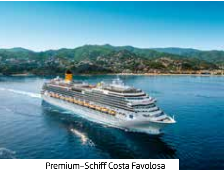
Premium-Schiff Costa Favolosa