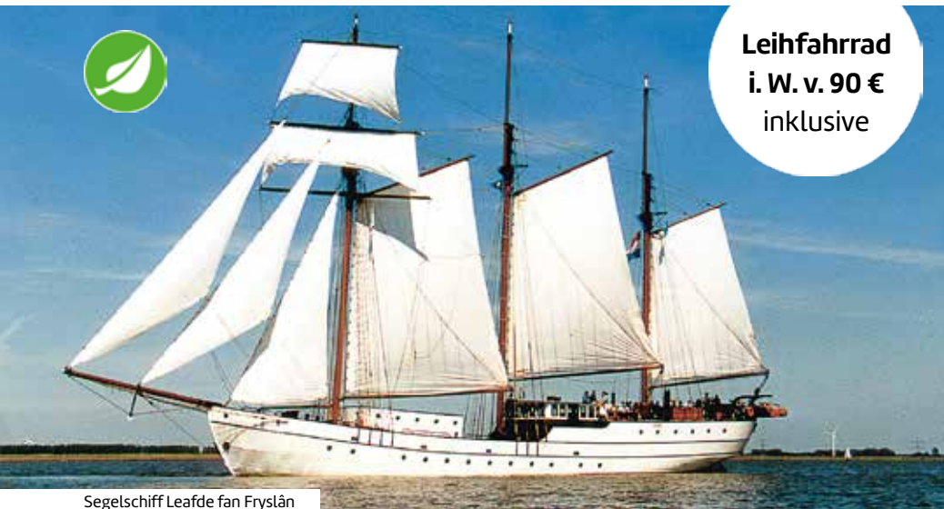
Segelschiff Leafde fan Fryslân