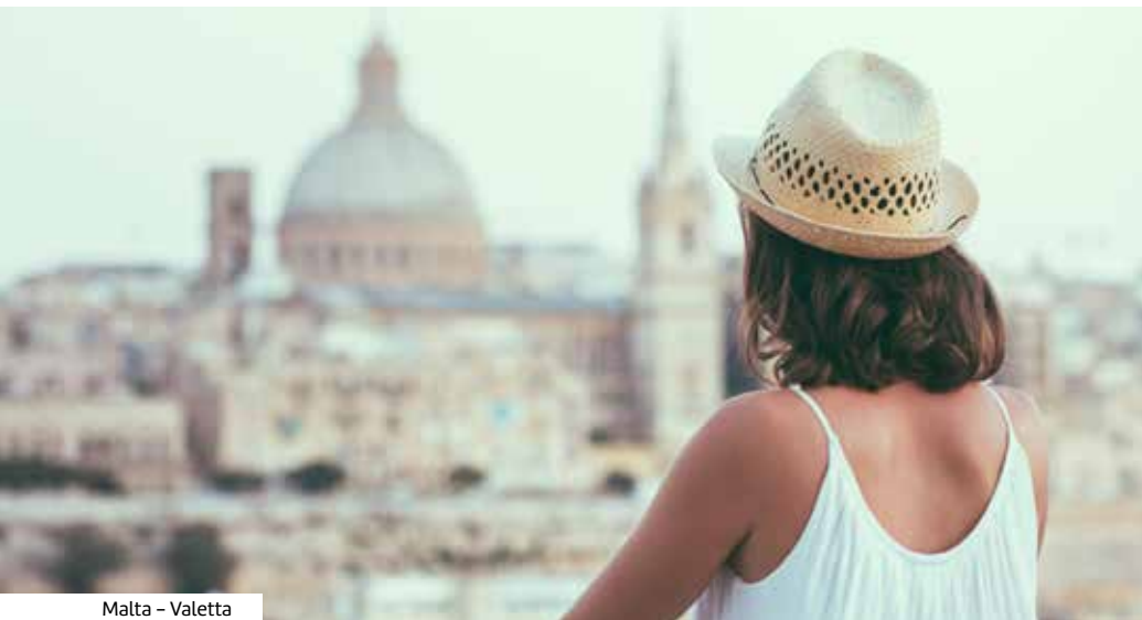
Malta – Valetta