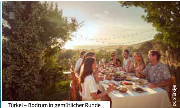
Türkei – Bodrum in gemütlicher Runde