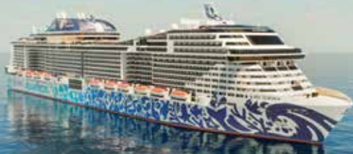
Premium-Plus-Schiff MSC Euribia