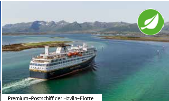
Premium-Postschiff der Havila-Flotte