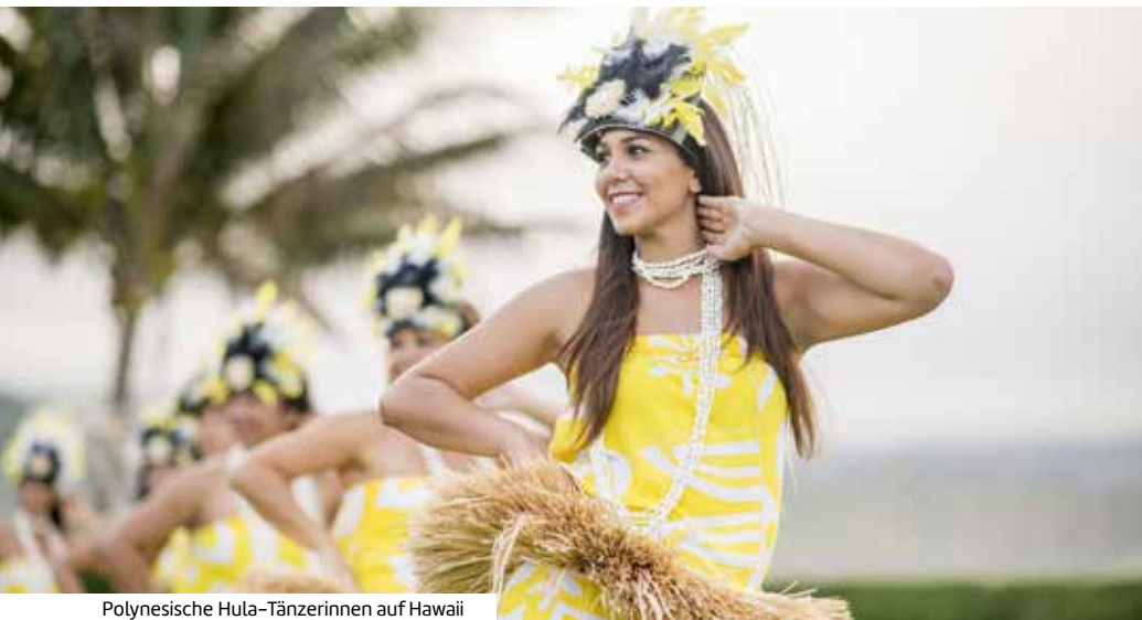
Polynesische Hula-Tänzerinnen auf Hawaii