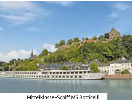
Mittelklasse-Schiff MS Botticelli