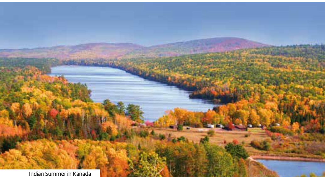
Indian Summer in Kanada