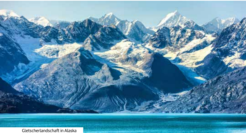
Gletscherlandschaft in Alaska