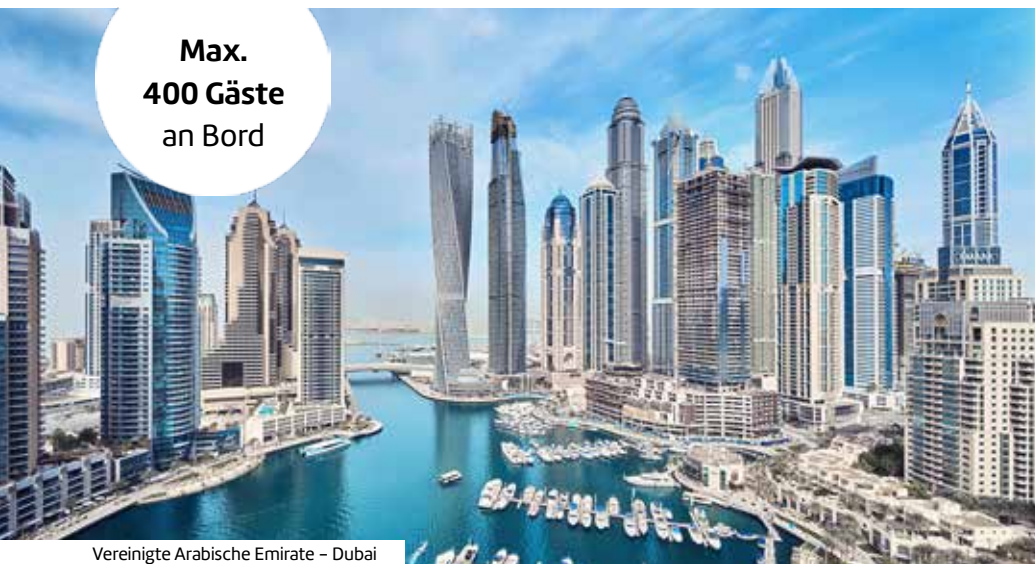
Vereinigte Arabische Emirate – Dubai