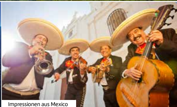
Impressionen aus Mexiko