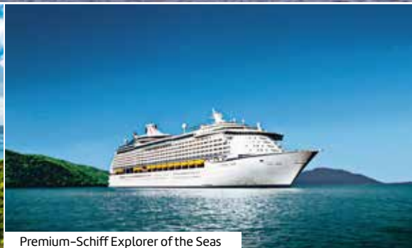
Premium-Schiff Explorer of the Seas