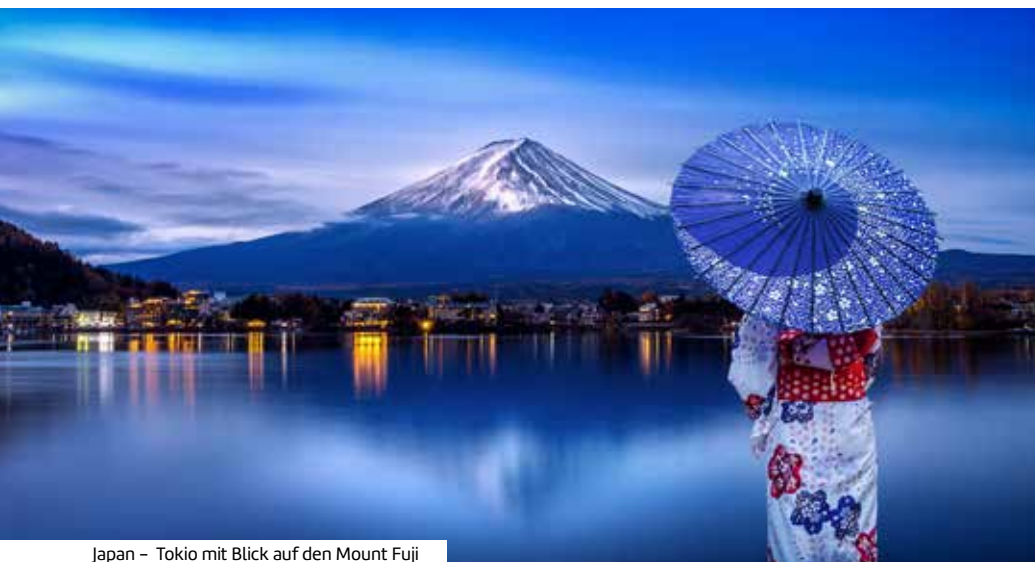
Japan – Tokio mit Blick auf den Mount Fuji