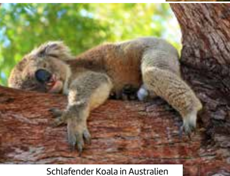
Schlafender Koala in Australien