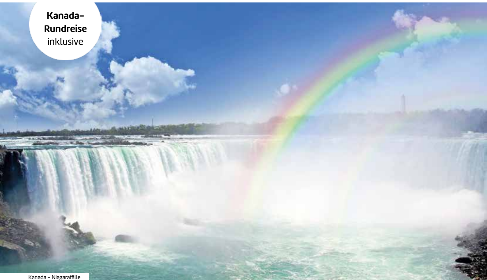
Kanada – Niagarafälle