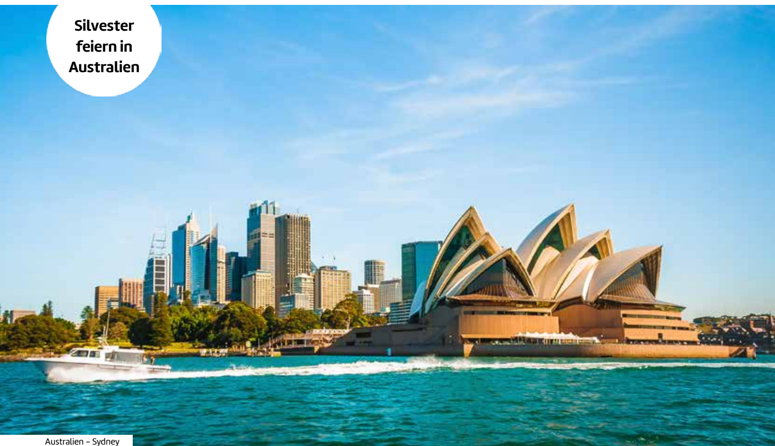
Australien - Sydney