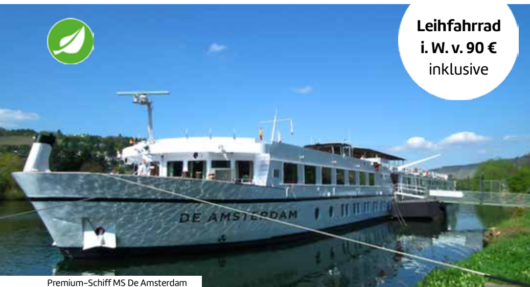
Premium-Schiff MS De Amsterdam