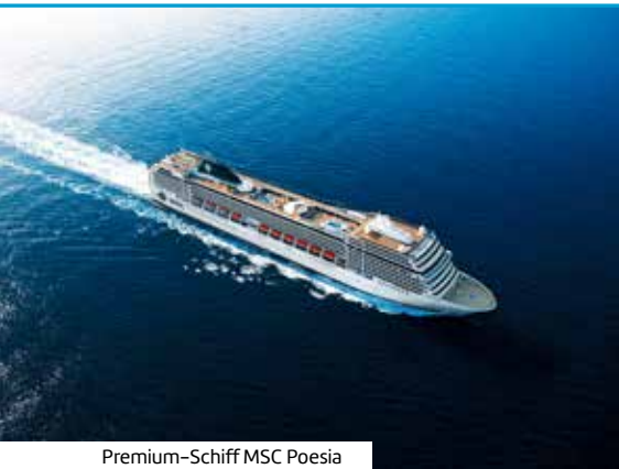
Premium-Schiff MSC Poesia