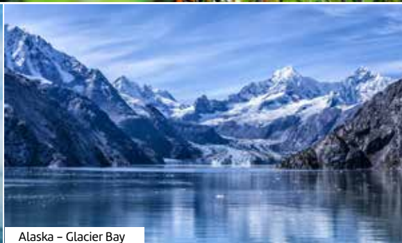
Alaska – Glacier Bay