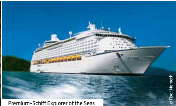
Premium-Schiff Explorer of the Seas