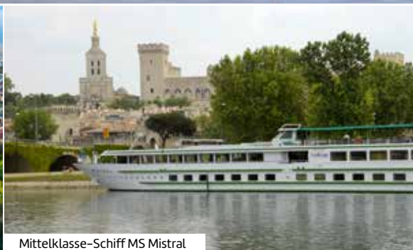
Mittelklasse-Schiff MS Mistral