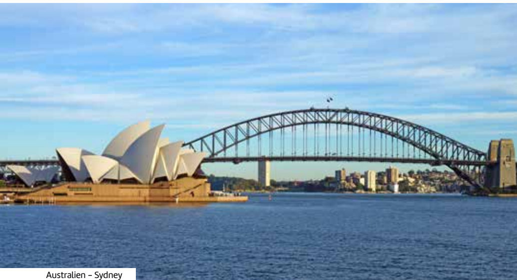
Australien – Sydney