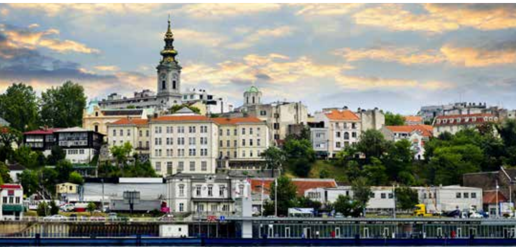
Serbien – Belgrad