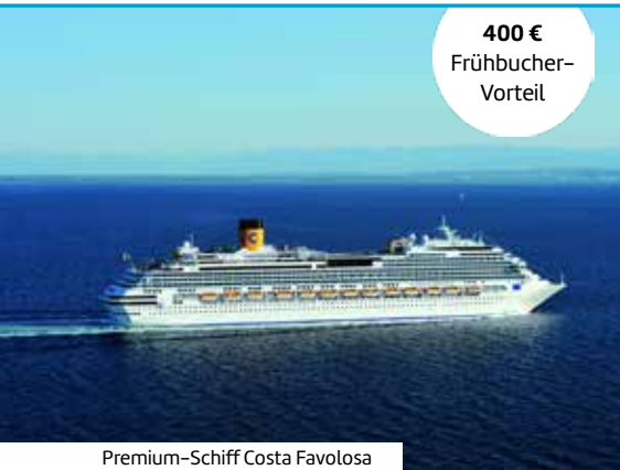
Premium-Schiff Costa Favolosa