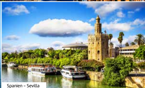
Spanien – Sevilla