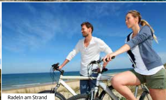
Radeln am Strand