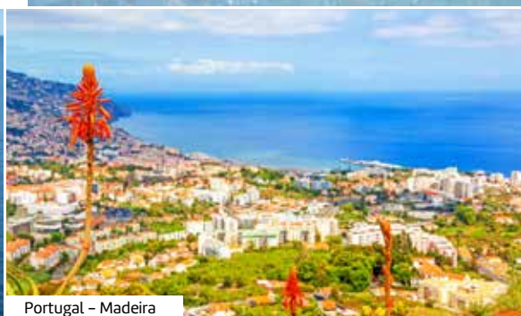
Portugal – Madeira