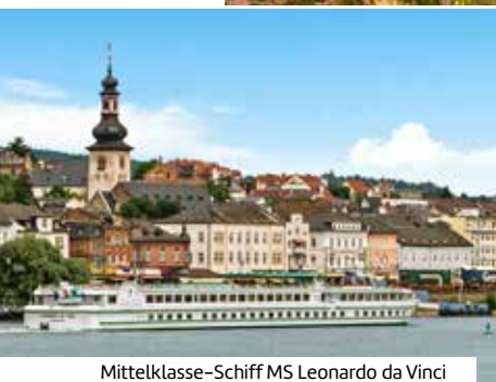
Mittelklasse-Schiff MS Leonardo da Vinci