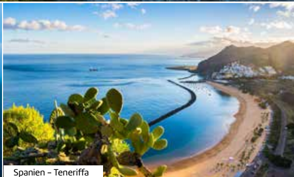
Spanien – Teneriffa