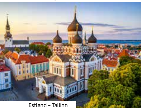
Estland – Tallinn

Fahrtwind genießen auf Ihrem DFDS-Fährschiff