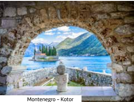
Montenegro – Kotor