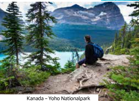
Kanada – Yoho Nationalpark