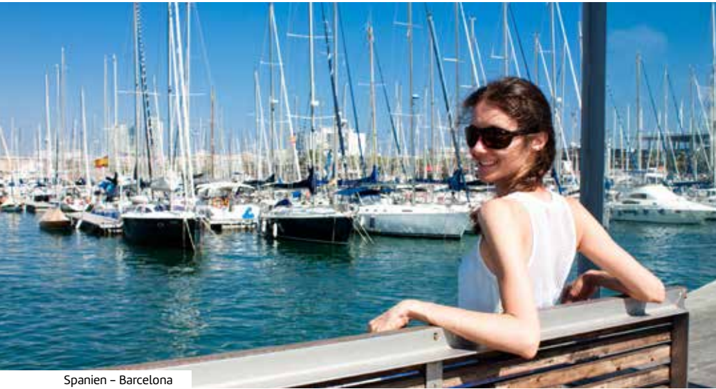
Spanien - Barcelona