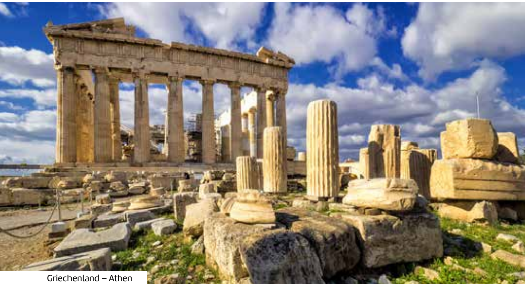
Griechenland – Athen