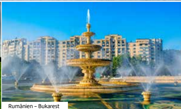
Rumänien – Bukarest