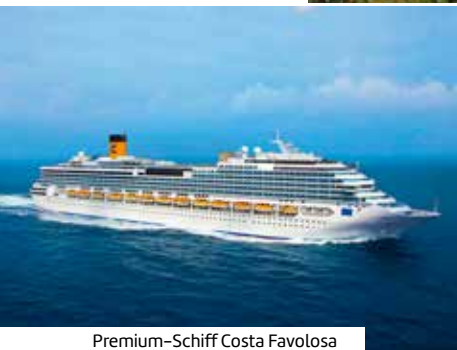
Premium-Schiff Costa Favolosa