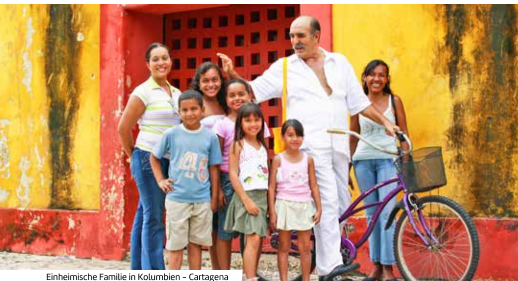
Einheimische Familie in Kolumbien – Cartagena