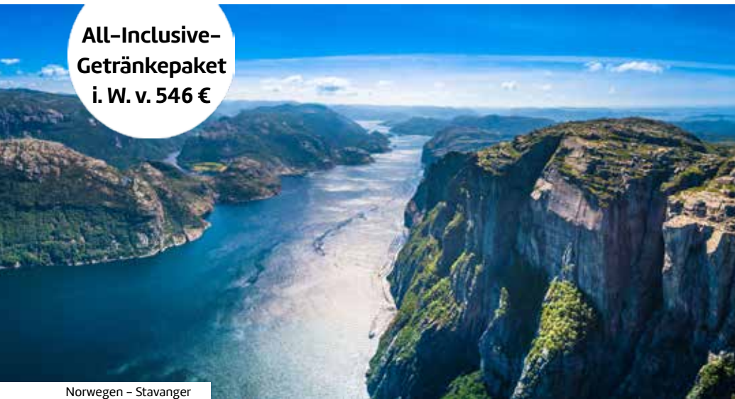
Norwegen – Stavanger

All-Inclusive- Getränkepaket i. W. v. 546 €