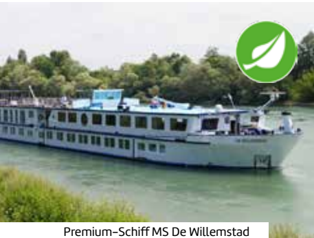
Premium-Schiff MS De Willemstad

Mehr Informationen, Einreisebestimmungen und Buchung unter: www.berge-meer.de/K84131