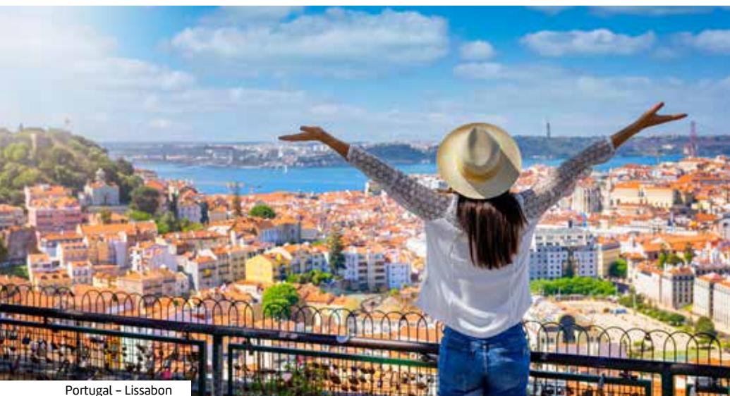
Portugal – Lissabon