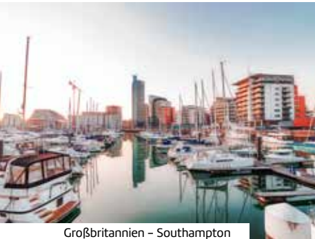
Großbritannien - Southampton

Mehr Informationen, Einreisebestimmungen und Buchung unter: www.berge-meer.de/K8W434