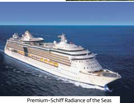
Premium-Schiff Radiance of the Seas