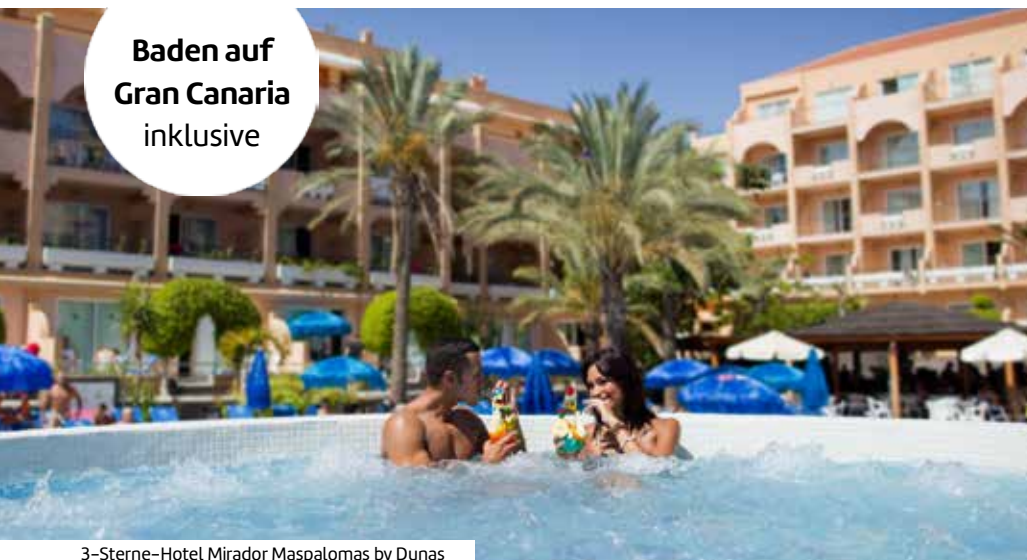
3-Sterne-Hotel Mirador Maspalomas by Dunas