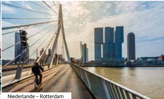
Niederlande - Rotterdam