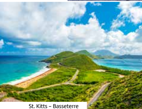
St. Kitts - Basseterre