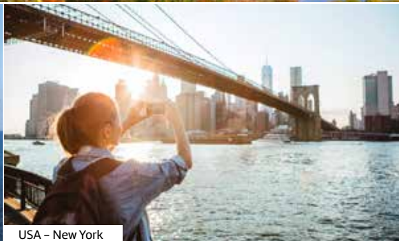
USA - New York