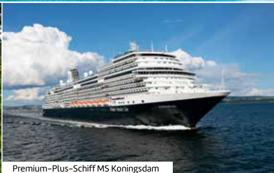
Premium-Plus-Schiff MS Koningsdam