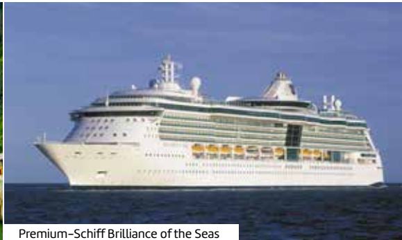
Premium-Schiff Brilliance of the Seas