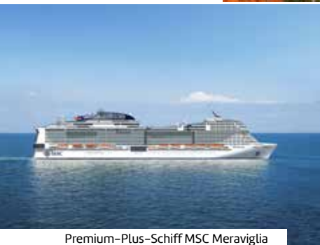
Premium-Plus-Schiff MSC Meraviglia