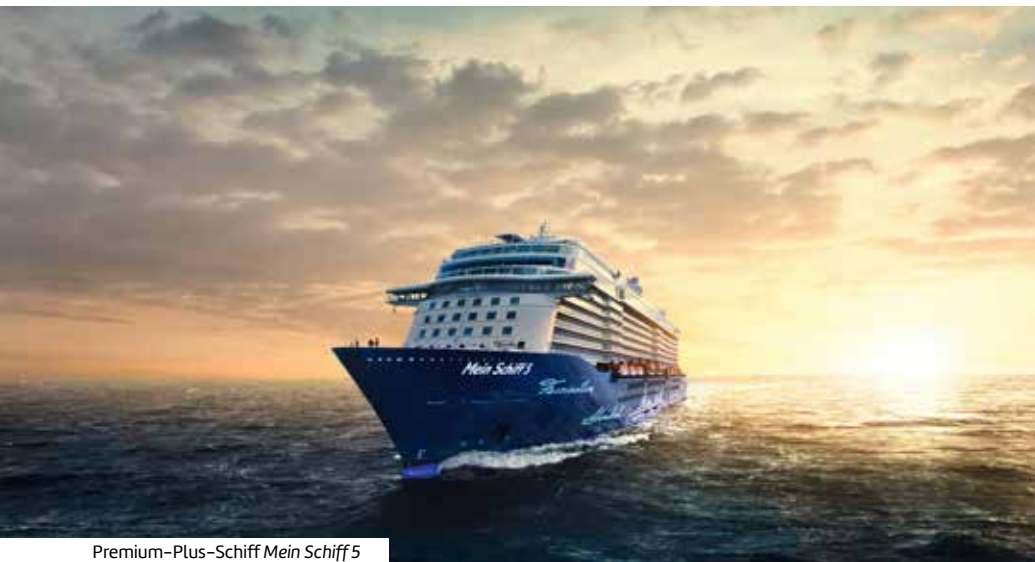
Premium-Plus-Schiff Mein Schiff 5