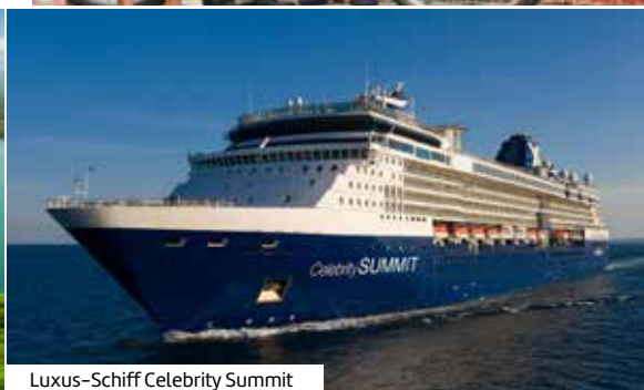
Luxus-Schiff Celebrity Summit