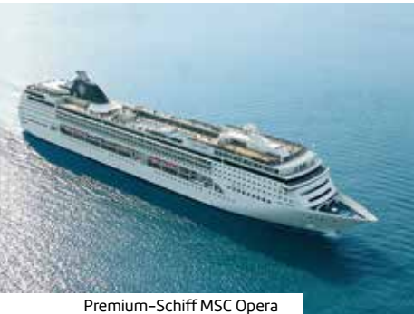
Premium-Schiff MSC Opera

Sie erhalten einen unbegrenzten Genuss an alkoholfreien und alkoholischen Getränken. Dazu gehören ausgewählte Weine & Prosecco (glasweise), Fassbier, Longdrinks, Cocktails, Softgetränke, Säfte, Mineralwasser und klassische Heißgetränke (Espresso, Cappuccino, Tee, etc.) sowie alle Getränke der Bar-Karte bis zu einem Preis von 6 €. Die im Paket enthaltenen Getränke können in allen Bars, Buffet-Restaurants und Restaurants verzehrt werden. Nicht in den Spezialitätenrestaurants gültig.