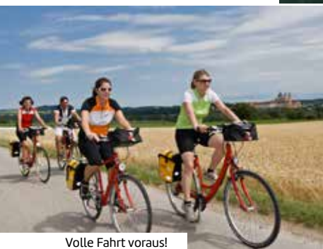
Volle Fahrt voraus!