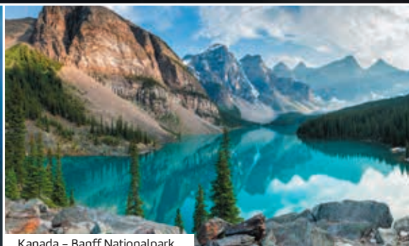
Kanada – Banff Nationalpark