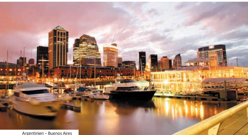
Argentinien – Buenos Aires