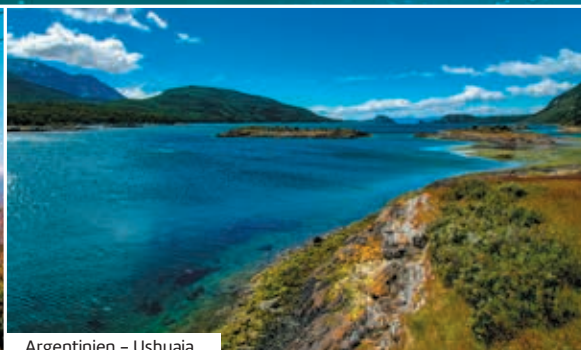
Argentinien – Ushuaia