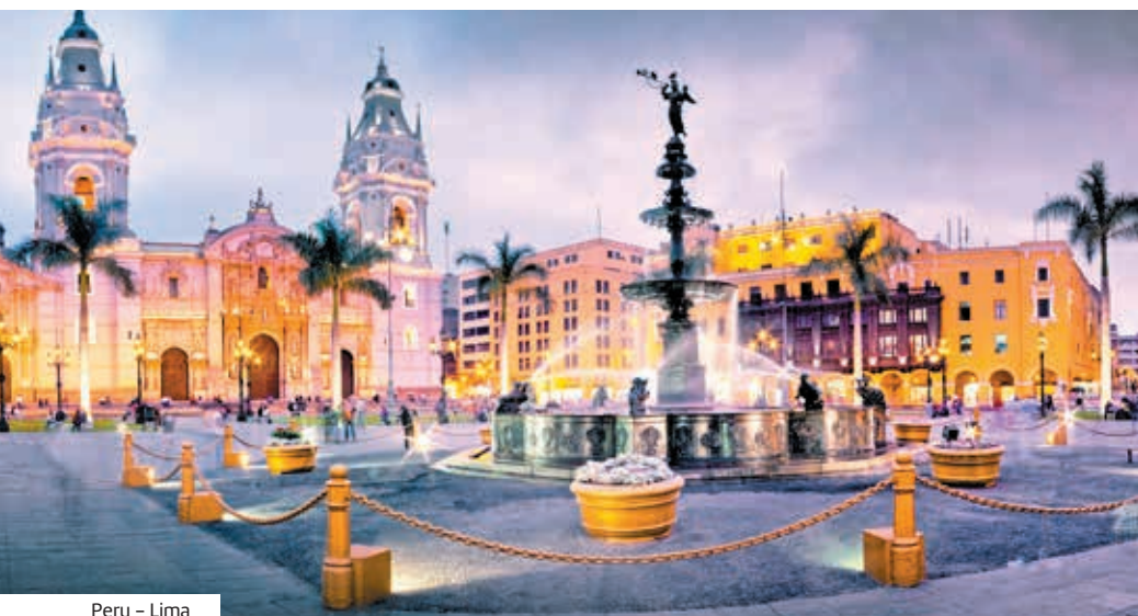
Peru – Lima