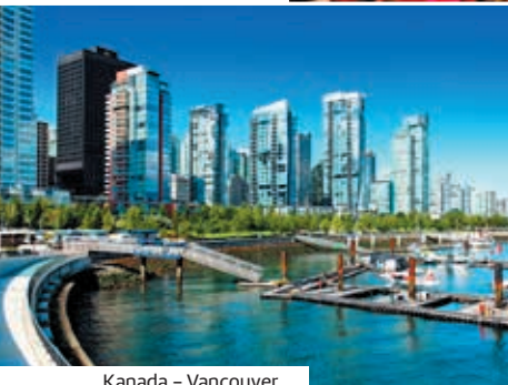
Kanada – Vancouver