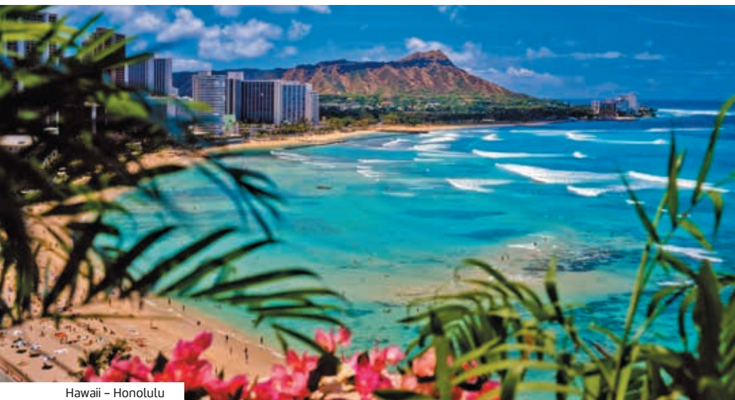
Hawaii – Honolulu