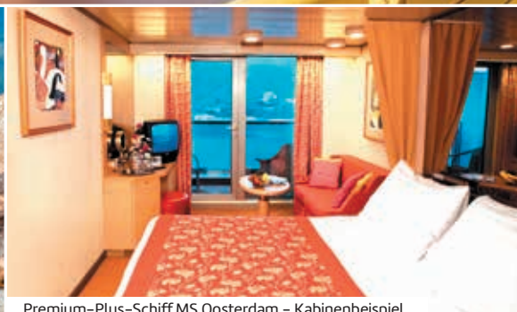
Premium-Plus-Schiff MS Oosterdam – Kabinenbeispiel