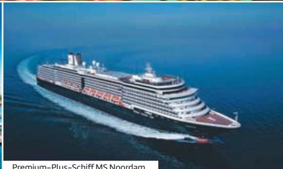
Premium-Plus-Schiff MS Noordam