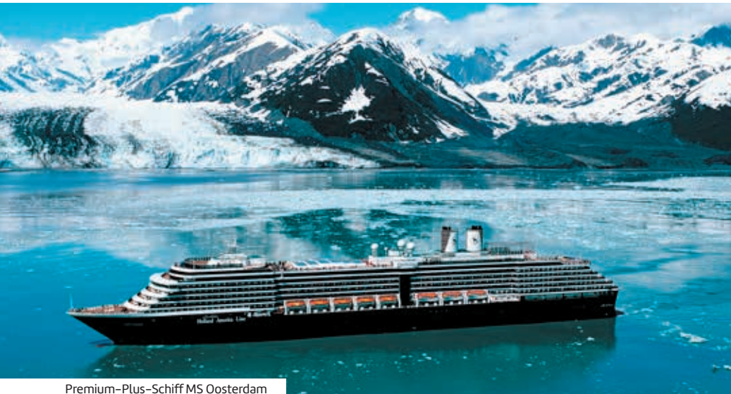
Premium-Plus-Schiff MS Oosterdam