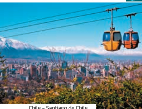
Chile – Santiago de Chile