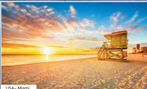
USA – Miami