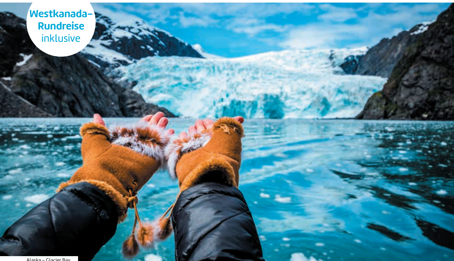
Alaska – Glacier Bay