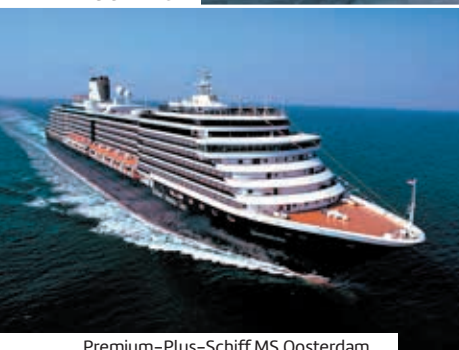
Premium-Plus-Schiff MS Oosterdam