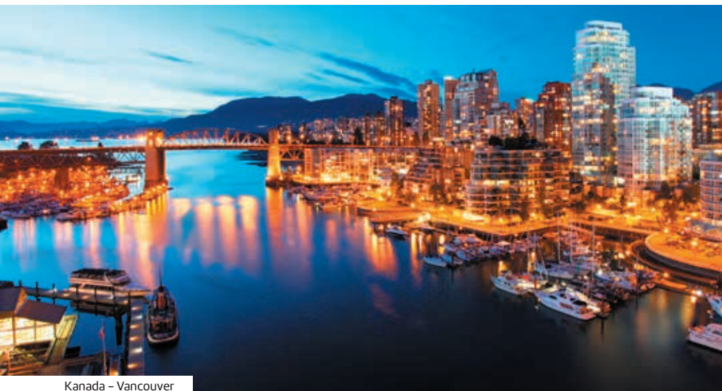
Kanada – Vancouver