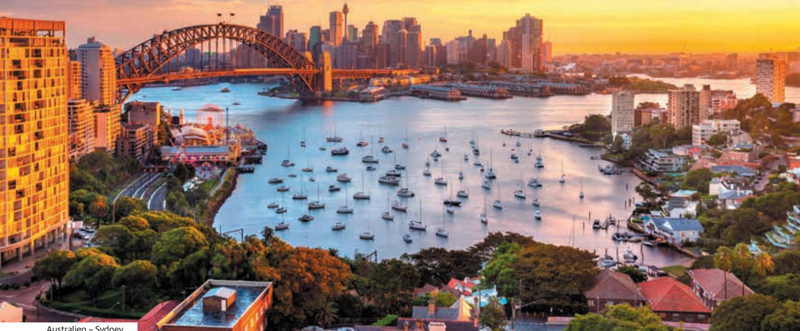
Australien – Sydney