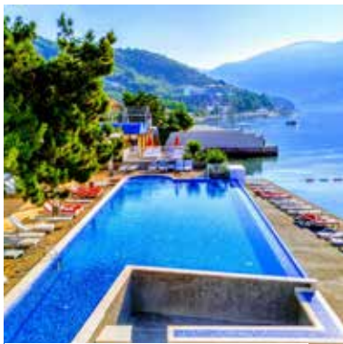
4-Sterne-Hotel Iberostar – Poolbereich