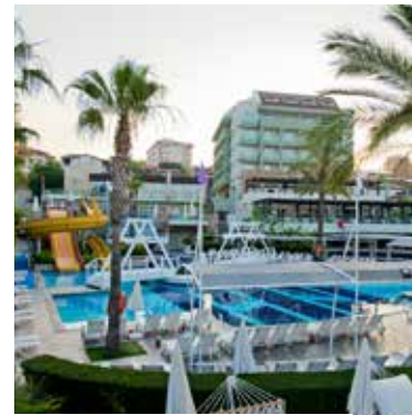
5-Sterne-Hotel Sealife Buket Beach