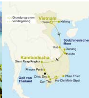
Vietnam – Halong-Bucht