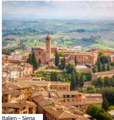
Italien – Siena