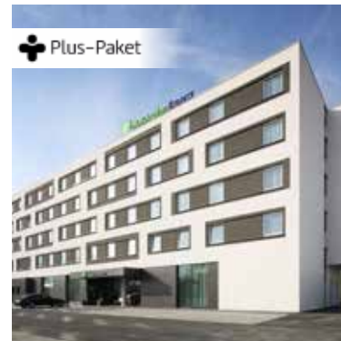
3.5-Sterne-Hotel Holiday Inn Express