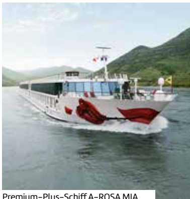
Premium-Plus-Schiff A-ROSA MIA