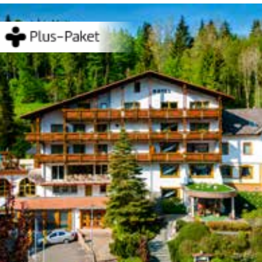
4-Sterne-Hotel Holzschuh's Schwarzwaldhotel