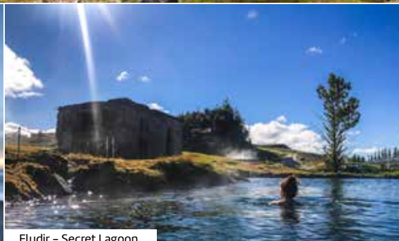
Fludir – Secret Lagoon