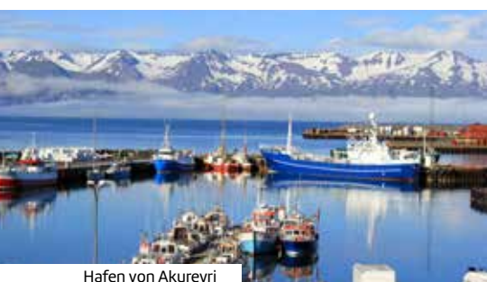
Hafen von Akureyri