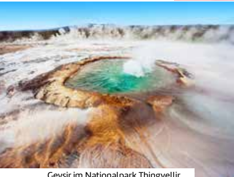
Geysir im Nationalpark Thingvellir