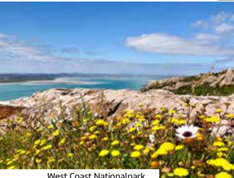
West Coast Nationalpark