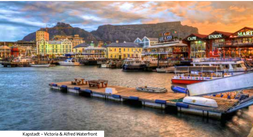
Kapstadt – Victoria & Alfred Waterfront