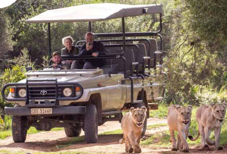
Botlierskop Private Game Reserve