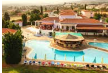
4-Sterne-Hotel Akamanthea Holiday Village