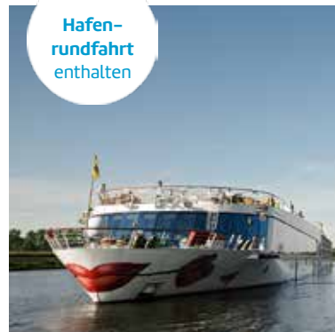
Premium-Plus-Schiff A-ROSA SILVA