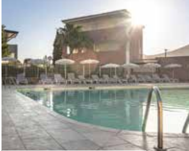
Ferienhotel Maristella auf Korsika