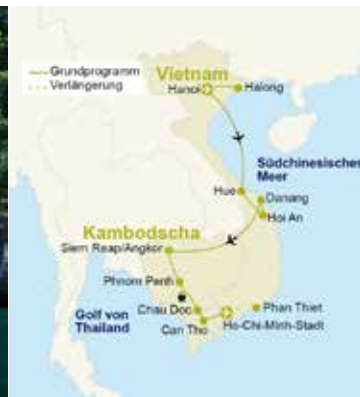
Vietnam – Halong Bucht