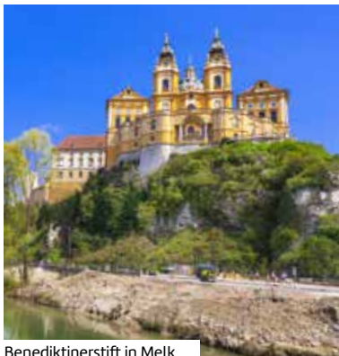
Benediktinerstift in Melk