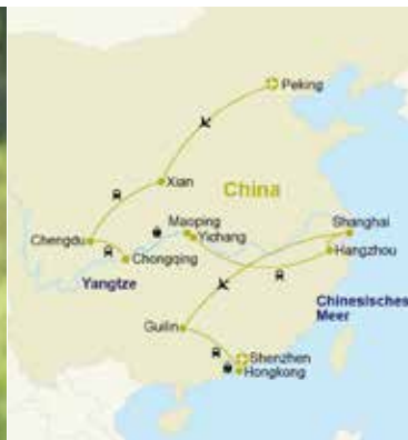
Chengdu – Pandabären-Aufzuchtstation