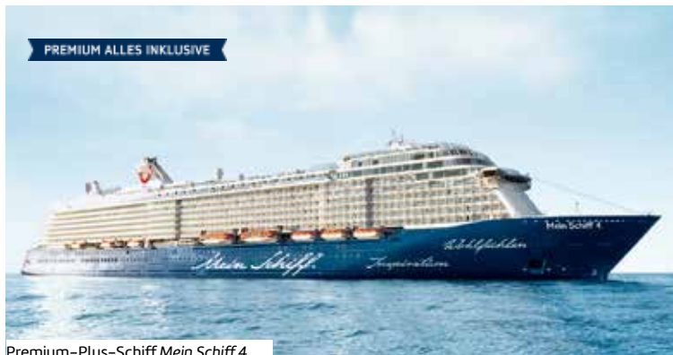
Premium-Plus-Schiff Mein Schiff 4