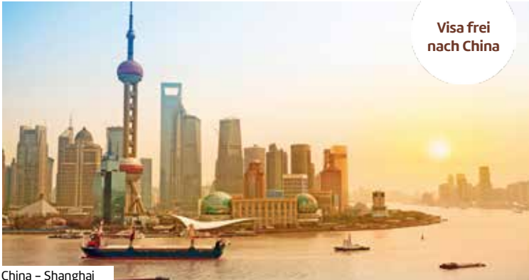
China – Shanghai