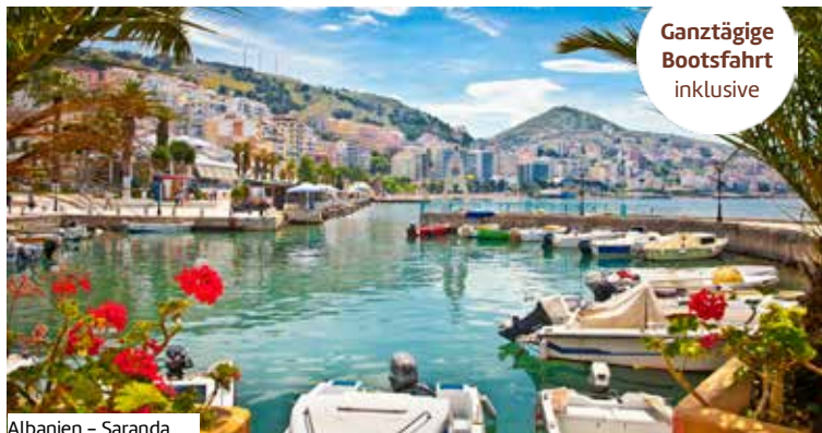
Albanien – Saranda