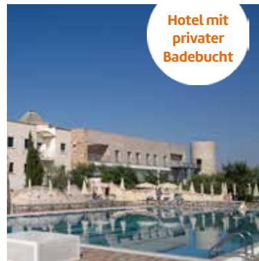
4-Sterne-Hotel Scoglio Degli Achei

Mehr Infos zu dieser Reise unter www.berge-meer.de/HFK004