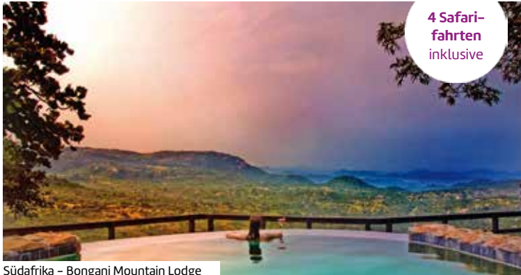
Südafrika – Bongani Mountain Lodge