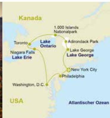
USA – Adirondack Park