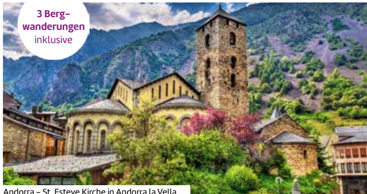
Andorra – St. Esteve Kirche in Andorra la Vella