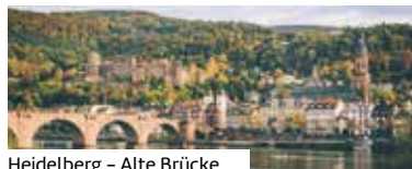
Heidelberg – Alte Brücke