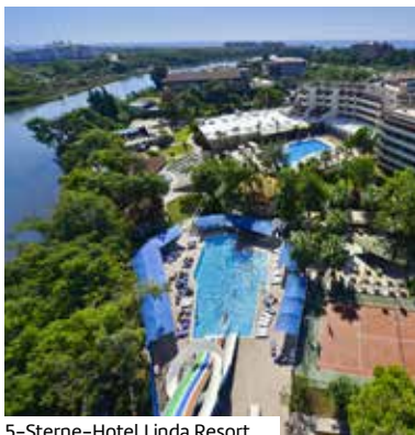
5-Sterne-Hotel Linda Resort