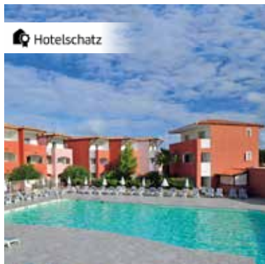
Korsika – Ferienhotel Maristella