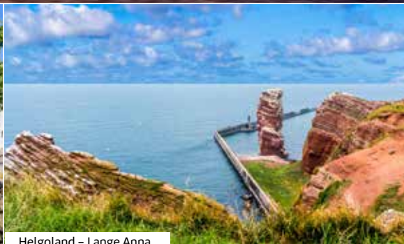
Helgoland – Lange Anna