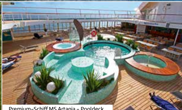
Premium-Schiff MS Artania – Pooldeck