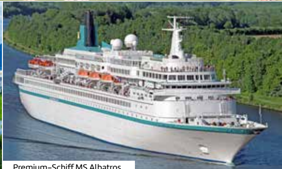
Premium-Schiff MS Albatros