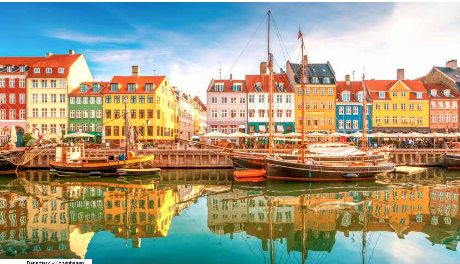
Dänemark - Kopenhagen