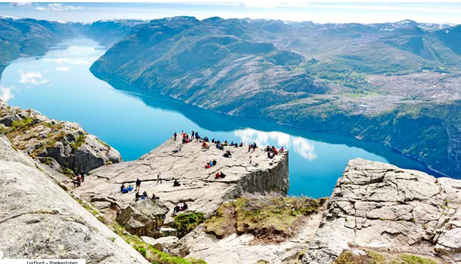
Lysfjord – Preikestolen