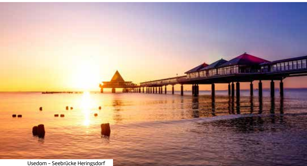
Usedom – Seebücke Heringsdorf