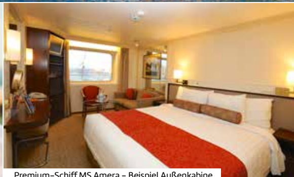
Premium-Schiff MS Amera – Beispiel Außenkabine