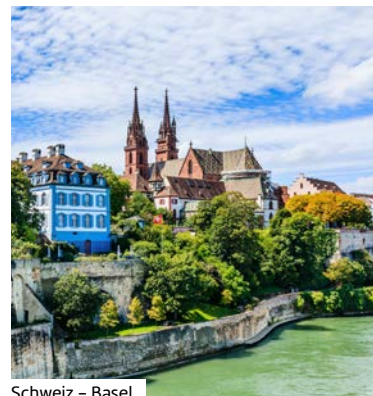
Schweiz – Basel