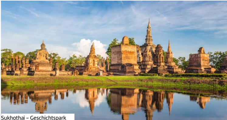
Sukhothai – Geschichtspark