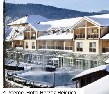
4-Sterne-Hotel Herzog Heinrich