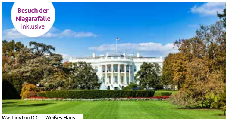
Washington D.C. – Weißes Haus