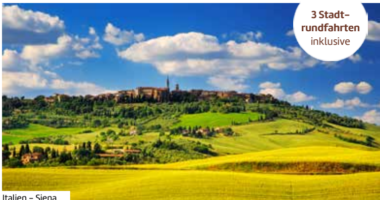
Italien – Siena