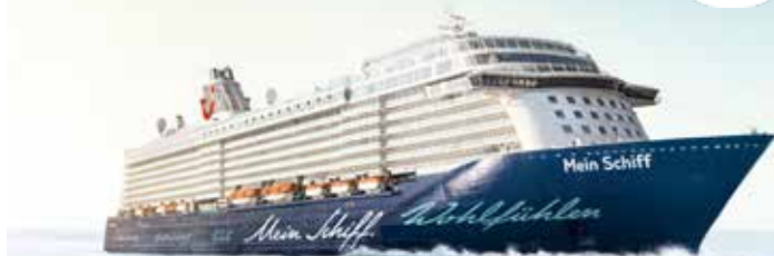
Premium-Plus-Schiff neue Mein Schiff 2