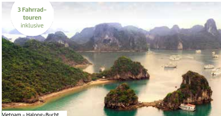
Vietnam - Halong-Bucht