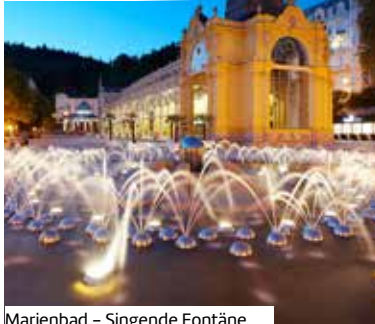
Marienbad – Singende Fontäne