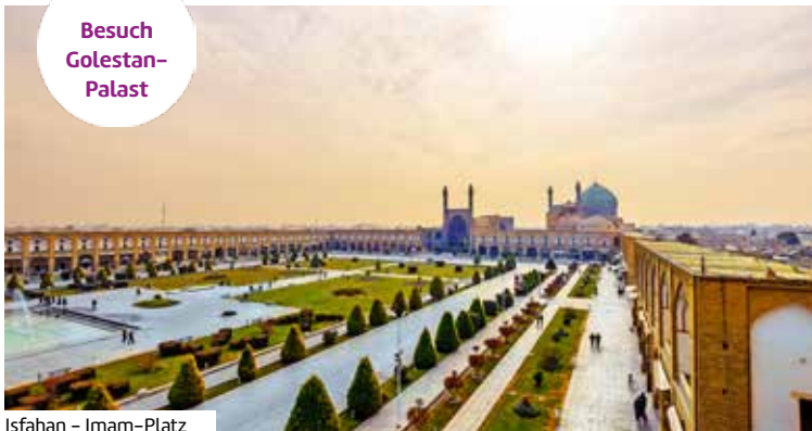
Isfahan - Imam-Platz